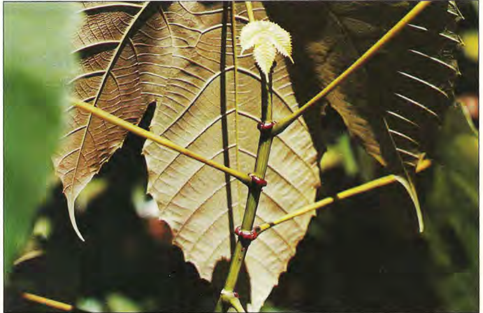
Tige de Macaranga triloba (Reinwardt) présentant des stipules rouges qui portent des trophosomes ou corps beccariens. A Singapour, la fourmi Crematogaster borneensis (André) vit à l'intérieur des tiges. (Cliché P. Jolivet).

capacité du système, car sans la plante la fourmi ne peut survivre et sans la fourmi, la plante meurt à plus ou moins brève échéance. On peut choisir quelques exemples pris chez les plantes les plus caractéristiques. Les jardins de fourmis, autre forme de coopération, attireront également notre attention, car l'association, longtemps contestée, existe bel et bien et reste très performante, la plante attirant la fourmi et la fourmi semblant planter réellement le jardin.