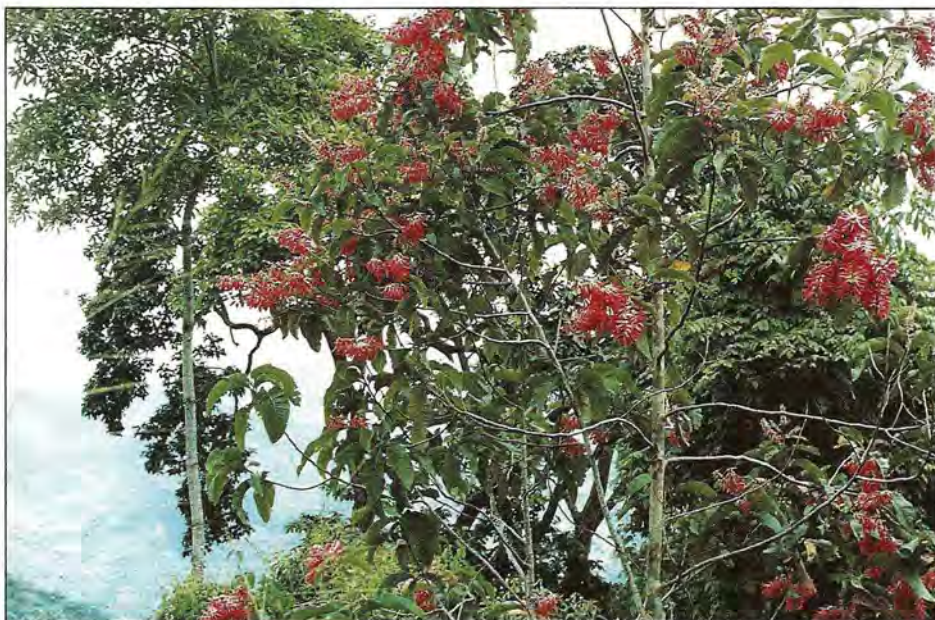
Triplaris caracasana Cham. (Polygonaceae) en fleurs au Venezuela. Cet arbre abrite dans ses entre-nœuds, les féroces fourmis Pseudomyrmex qui piquent dès le moindre atouchement de l'arbre. (Cliché P. Jolivet).

La coévolution ou évolution simultanée, par actions réciproques, des plantes et des fourmis a dû s'accomplir sur des millions d'années et a dû débiter probablement au Mésozoïque avec l'apparition des fourmis. Toutes les recherches sérieuses de ces dix dernières années, essentiellement anglo-saxonnes, concluent sans exception à l'effi-