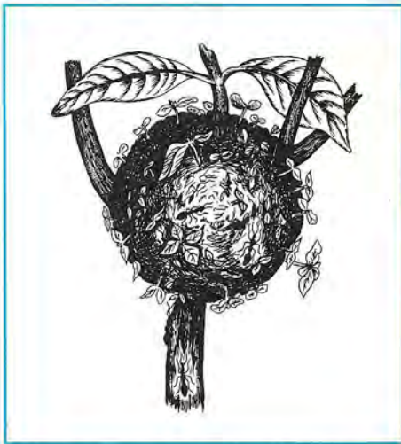
"Jardin de fourmis", nid aérien couvert de jeunes pousses de plantes amenées à l'état de graines par les fourmis. (D'après Ule, 1906, modifié par L.H. Henry).

abouti à des urnes très compliquées chez certaines espèces qui absorbent les excréments et les cadavres des fourmis : Dolichoderus , Crematogaster et Iridomyrmex , grâce à des racines internes. Diverses fourmis vivent à l'intérieur des Dischidia . Parmi les Rubiacées myrmécophiles de l'Asie du Sud-Est, les Myrmecodia , les Hydnophytum et quatre ou cinq autres genres apparentés, abritent de nombreuses fourmis, en particulier les Iridomyrmex . Chez ces épiphytes, l'axe hypocotyle enflé devait constituer originellement un réservoir d'eau. Il s'est adapté aux fourmis et forme un nid naturel qui se développe, même sans fourmi. Ce nid est extrêmement compliqué avec des chambres spécialisées pour les excréments (latrines) et les cadavres, avec des verrues et racines internes absorbantes, des chambres à couvain. J'ai étudié en détail la biologie de ces plantes et de leurs hôtes, les Iridomyrmex , qui peuvent à l'occasion se montrer extrêmement agressives. Curieusement, ces étranges Rubiacées épiphytes et myrmécophiles ont un système de ventilation et de climatisation (pores et cellules alvéolaires) qui ressemble étrangement aux conduits d'aération des termitières australiennes. La climatisation est fournie aux fourmis par la nature chez les Myrmecodia alors qu'elle est due à une construction très élaborée chez les Termites.