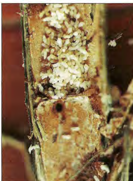
Le nid ouvert des féroces fourmis Pseudomyrmex à l'intérieur des entre-nœuds d'une tige de Triplaris pyramidalis Jacq. en Amazonie. (Cliché P. Jolivet).