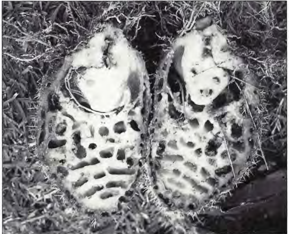
Coupe médiane de tubercules entrés de Myrmecodia schlechteri Valetou, Rubiacée épiphyte sur Casuarina nodiflora en Nouvelle Guinée. On peut observer les cavités occupées par les fourmis et quelques racines internes. Les épines (racines modifiées caractéristiques du genre) sont visibles autour du tubercule.

la tige en un point de moindre résistance, le prostoma, afin d'y pondre leurs œufs.