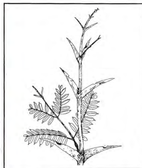
Acacia sphaerocephala Schul. & Cham. présentant des épines stipulaires habitées par des fourmis Pseudomyrmex . Les extrémités de folioles modifiées en corps bertiens sont récoltées et mangées par les fourmis. On observe aussi les nectaires extrafloraux près de la base du pétiole (d'après Schimper, 1888).