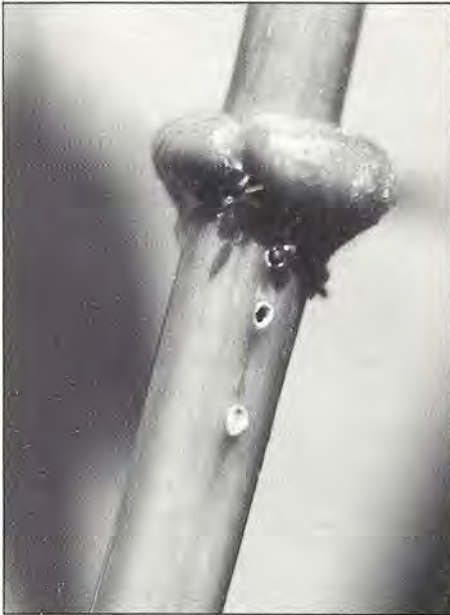
Détail de la tige de Macaranga triloba montrant les stoma ou points d'entrée des fourmis, ainsi que les stipules. (Cliché P. Jolivet).