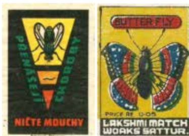
▲ Boîtes d'allumettes ▲

Figurine perce-oreille transformable