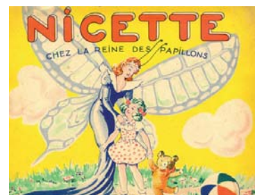
Nicette chez la reine des papillons . Éd. René Thouret, 1947.

Extrait de : Guide pratique d'entomologie agricole, et petit traité de la destruction des insectes nuisibles , par Henri Gobin ; E. Lacroix (Paris), 1865. En ligne à //gallica.bnf.fr/