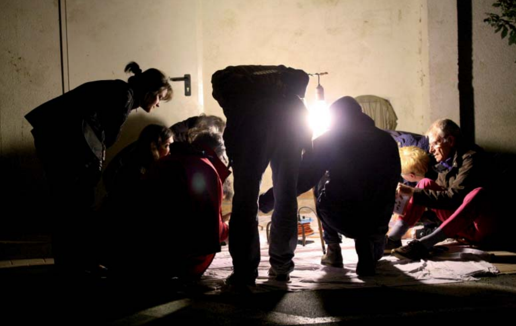
Animation découverte des papillons de nuit à Bernay-Vilbert, le 25 septembre 2014