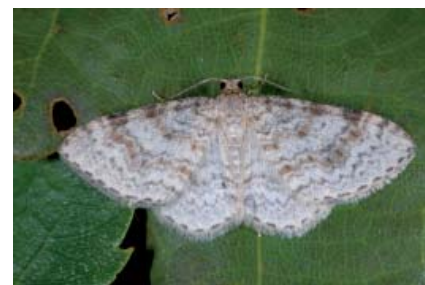
La Cidarie sylvestre

entomologistes le pensaient même disparu de la région puisque les dernières observations en Île-de-France dataient du début du XX e siècle dans l'Essonne et le Val-d'Oise. C'est une espèce sub-montagnarde dont la chenille se nourrit sur divers feuillus : le bouleau, l'aulne, le noisetier ou encore le châtaignier. Présente surtout dans la moitié nord-est de la France et dans les Pyrénées, elle a tendance à se raréfier considérablement en plaine. Sa découverte dans le centre de la Seine-et-Marne constitue donc une heureuse surprise, et nous tenterons l'année prochaine de vérifier la présence d'une véritable population à cet endroit.