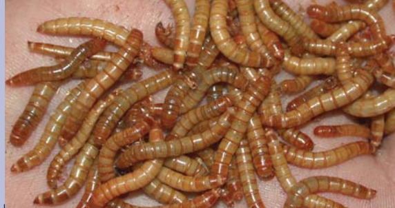
Vers de farine