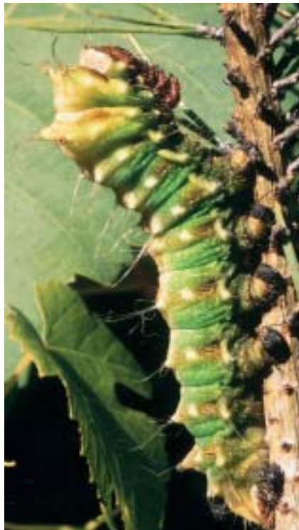
Chenille hybride de 6 e stade sur un rameau de pin sylvestre

Robert Vuattoux Le Grand Bouchard - 644, avenue des Corailleurs - 83370 St Aygulf vuattoux.bob@wanadoo.fr