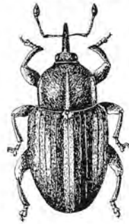
- Tychius venustus Fabricius, 1791 - in Faune de France - Coléoptères Curculionidés - Adolphe Hoffmann - Éd. Lechevalier

nides consomment les feuilles des Génistées, les larves s'attaquant aux racines. Un des plus communs est Polydrusus confluentis . Deux Sitones, Sitona tibialis de coloration cendrée et S. griseus , gris-brun rouge, se nourrissent de feuilles alors que leurs larves dévorent les jeunes racines et probablement les nodosités bactériennes. Tychius venustus est une espèce fort curieuse, fréquente sur les spartes, dont les larves vivent à l'intérieur des gousses qui se déforment et s'incurvent unilatéralement. Une espèce voisine, Pachytychius sparsutus fréquente plutôt les sarothamnes. Les larves de deux Apions, Apion striatum et A. immune se nourrissent de l'intérieur des rameaux de sarothamne qui se déforment en cécidies fusiformes. D'autres espèces vivent dans les gousses comme Apion fuscirostre . Parmi les Bruches dont les larves dévorent les graines dans