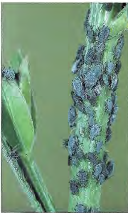
Les pucerons ( Aphis genistae ) colonisent les pousses tendres de l'année du genêt des teinturiers.

Gynaephora selenetica , surtout dans le Sud-Est, dont la chenille entre en hibernation et ne se nymphose qu'au printemps et Dicalloclomera fascelina , espèce univoltine aussi, mais dont les chenilles, après hibernation dans des toiles collectives, terminent leur croissance en mai. Les papillons apparaissent en juillet. Un bombyx, Lasiocampa trifolii , se rencontre aussi sur le Sarothamne. Ses œufs sont déposés au hasard en fin d'été, ils n'éclosent qu'au printemps. Les papillons volent en plein été. Parmi les Phalènes, on remarque souvent les chenilles de Chesias legatella et de C. rufata qui se nymphosent dans le sol en octobre ; les papillons volent en mai-juin, les œufs hivernent. Au repos, les chenilles miment des ramilles par leur position oblique formant un angle aigu avec la branchette. Parmi les Noctuelles, les chenilles vertes de Pseudoterpna pruinata hivernent, ne reprenant leur alimentation nocturne qu'en mai-juin ; de jour, elles sont toujours parfaitement immobiles. Celles de Lacanobia w-latinum effectuent la totalité de leur croissance en été ; les nymphes hivernent en cocon dans le sol. Apopestes spectrum est une espèce spectaculaire par sa grande taille