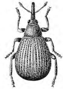
Apion striatum Kirby - in Faune de France - Coléoptères Curculionidés - Adolphe Hoffmann - Éd. Lechevalier

nides consomment les feuilles des Génistées, les larves s'attaquant aux racines. Un des plus communs est Polydrusus confluentis . Deux Sitones, Sitona tibialis de coloration cendrée et S. griseus , gris-brun rouge, se nourrissent de feuilles alors que leurs larves dévorent les jeunes racines et probablement les nodosités bactériennes. Tychius venustus est une espèce fort curieuse, fréquente sur les spartes, dont les larves vivent à l'intérieur des gousses qui se déforment et s'incurvent unilatéralement. Une espèce voisine, Pachytychius sparsutus fréquente plutôt les sarothamnes. Les larves de deux Apions, Apion striatum et A. immune se nourrissent de l'intérieur des rameaux de sarothamne qui se déforment en cécidies fusiformes. D'autres espèces vivent dans les gousses comme Apion fuscirostre . Parmi les Bruches dont les larves dévorent les graines dans