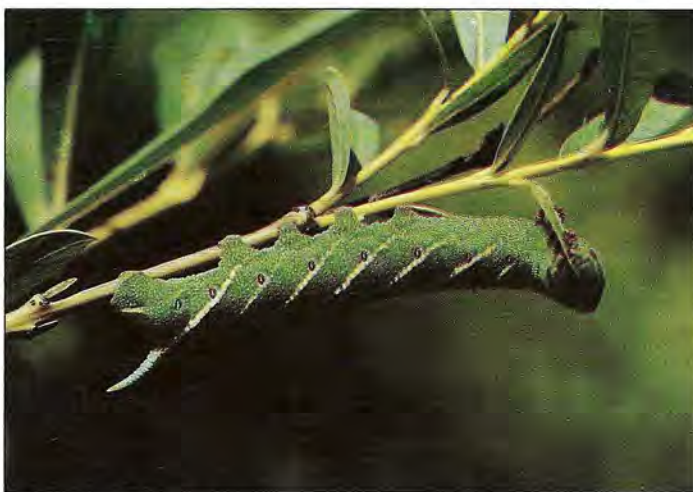
Chenille du Sphinx demi-paon Smerinthus ocellata s'alimentant de feuilles de Saule.