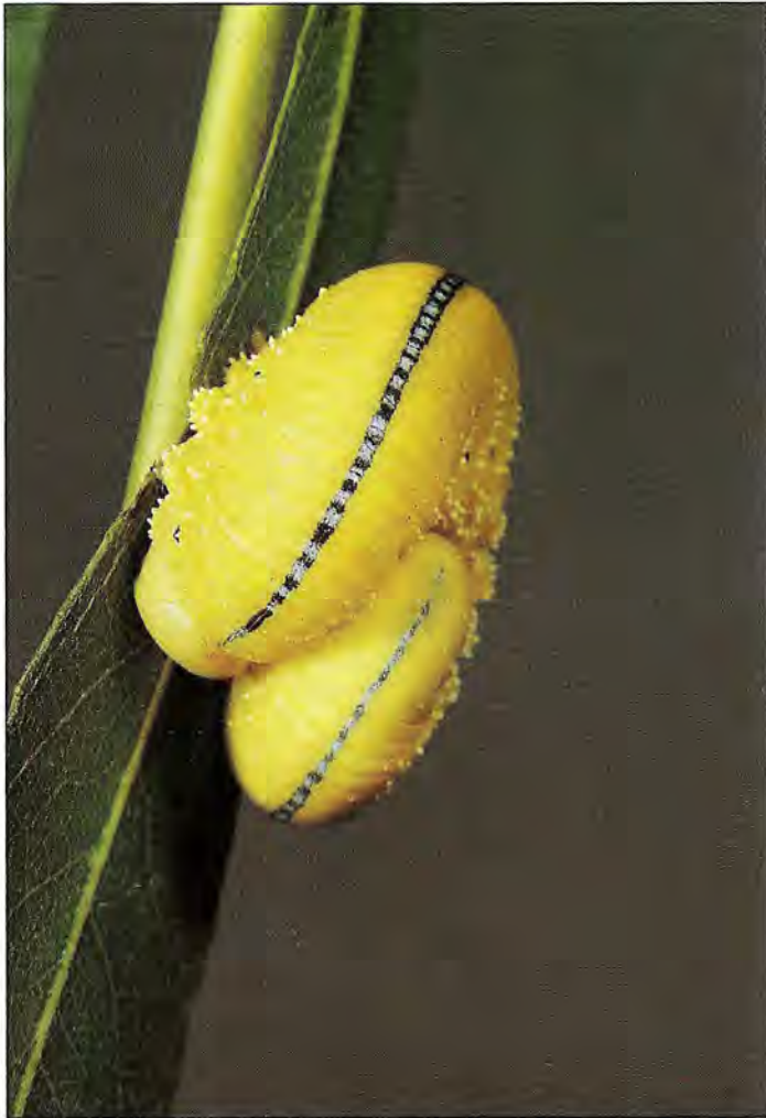
Larve de Cimbex lutea accrochée au repos sur une feuille de Saule pleureur.

Discrètement, au cours du printemps, les petites chenilles du Bombyx, Leucoma salicis , qui avaient hiverné au pied des souches envahissent les parties aériennes et dévorent le feuillage. Comme celles du Bombyx cul-brun, ces chenilles sont urticantes. Lorsqu'elles sont abondantes, les saules comme les peupliers sont presque totalement défeuillés. Parmi les autres espèces de chenilles, on peut s'attendre à trouver isolément celles du Sphinx du peuplier du Sphinx demi-paon, des Queues-Fourchues, des Harpyies, des Vanesses Morio et Grande Tortue, dont les œufs avaient été pondus en fin de printemps.