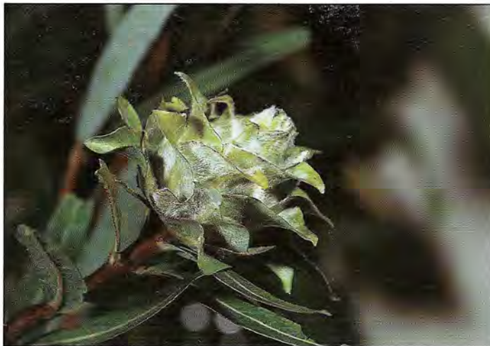
Galle en bouton de rose due à la Cécidomyie Rhabdophaga rosaria . Au centre de la galle, la loge ne contient qu'une seule larve. (Cliché R. Coutin - OPIE).

Lorsque le feuillage est développé, c'est l'époque où divers défoliateurs reprennent leur activité, en particulier plusieurs Coléoptères Chrysomélides qui avaient hiverné à l'état imaginal et qui perforent les feuilles de nombreux trous. Ce sont : Clytra laeviuscula , Phytodecta viminalis , Plagioderma versicolor , Phyllodecta vitellinae et P. vulgatissima , Melasoma cupreum et M. populi et des Altises du genre Chalcoides .