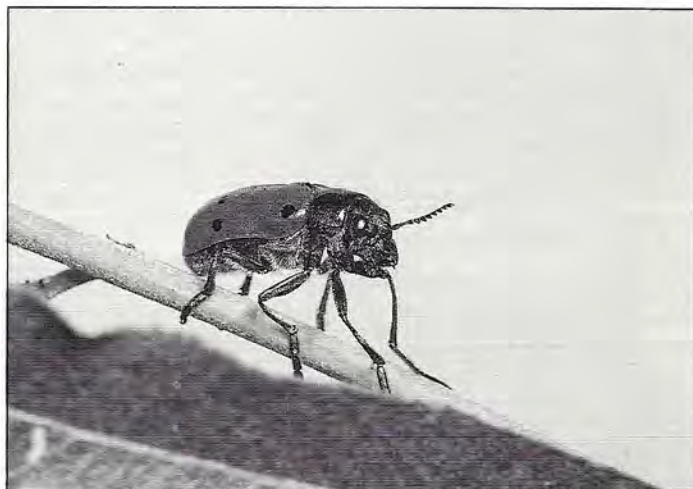
Adulte de Clytra sexpunctata se déplaçant sur une pousse de saule osier. (Cliché R. Coutin - OPIE).