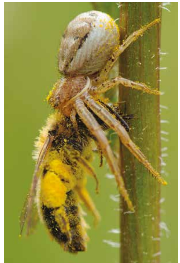
Une Thomise (Araneae, Thomisidé) capturant une Andrène (Hym. Andrénidé) à Larmor-Baden (Morbihan), mai 2008