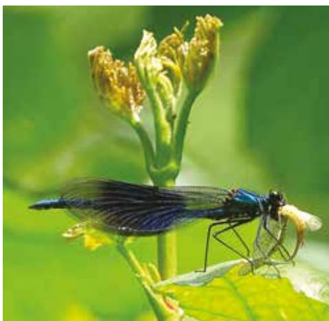
Caloptéryx éclatant ( Calopteryx splendens , Odo. Calopterygide) mâle croquant un éphémère, bords de la Viosne à Us (Val-d'Oise), mai 2016