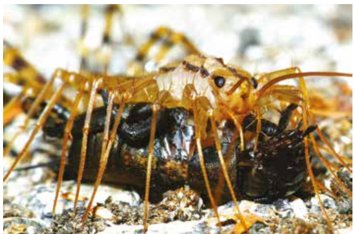
Scutigère véloce ( Scutigera coleoptrata , Myriapode Scutigéridé) avec sa proie un Grillon champêtre ( Gryllus campestris , Orth. Gryllidé), à Roybon (Isère), octobre 2018 - Cliché Philippe Servonnet