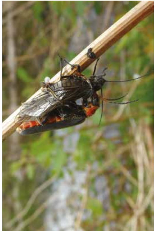
Cantharide commune ( Cantharis fusca , Col. Cantharidé) et sa victime, un Sialis de la vase ( Sialis lutaria , Mégal. Sialidé) sur les bords de la Moselle à Saint-Nabord (Vosges), mai 2014