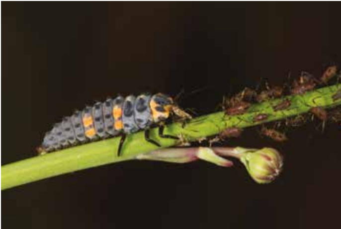
Larve de Coccinelle à sept points ( Coccinella septempunctata , Col. Coccinellidé) se repaissant de pucerons