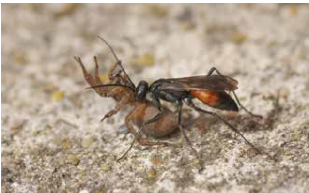
Pompile (Hym. Pompilidé) piquant une lycose (Araneae, Lycosidé) à Chaville (Hauts-de-Seine), juin 2013