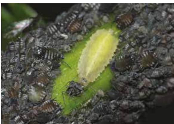
Larve de Syrphid du groseillier (Syrphus ribesii, Dip. Syrphidé) au milieu de son repas de Pucerons du sureau ( Aphis sambuci , Hém. Aphididé), mai 2013