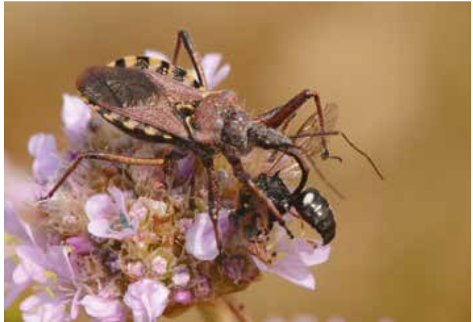
Réduve à pattes rouges ( Rhynocoris erythropus , Hém. Réduvidé) ponctionnant un Hym. Crabronidé du genre Oxybelus . Forêt de Fontainebleau (Seine-et-Marne), juillet 2015