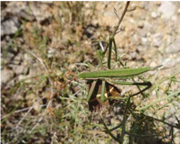
Magicienne dentelée ( Saga pedo , Ortho. Tettigoniidé) dévorant un Ocellé rubanné ( Pyronia bathseba , Léop. Satyriné) à Pignan (Hérault), mai 2015