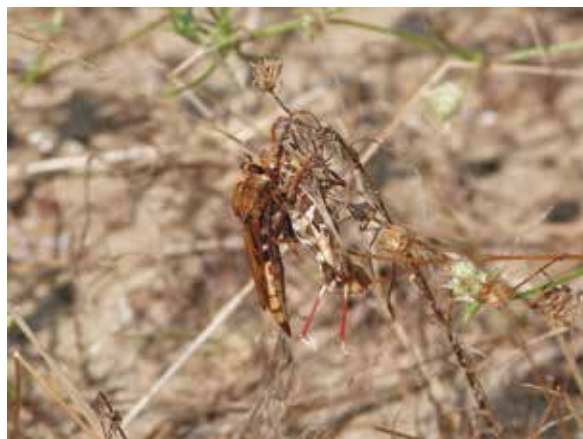
Asile frelon (Asilus crabroniformis, Dip. Asilidé) femelle dévorant un criquet (Oedipode soufrée : Oedaleus decorus , Orth. Acrididé), à La Tremblade (Charente-Maritime), août 2013.