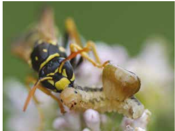
Poliste gaulois ( Polistes dominula , Hym. Vespidé) s'attaquant à une larve de tenthrède (Hym. Symphyte) à Bréviandes (Aube), juin 2015