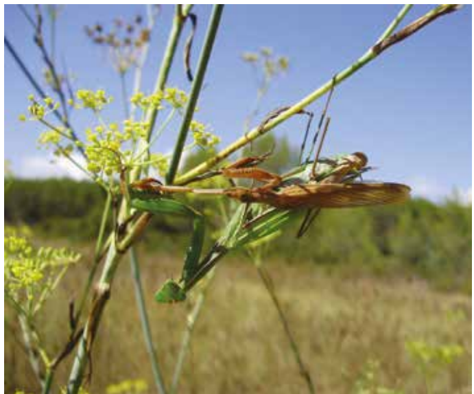
Mante religieuse ( Mantis religiosa , Mantodea Mantidé) dévorant son partenaire à Montpellier (Hérault), septembre 2014