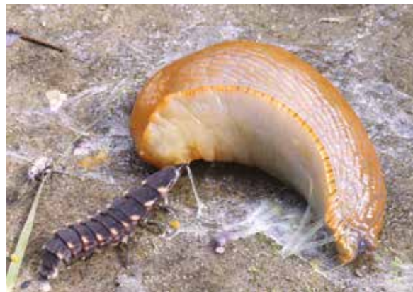
Ver luisant femelle (Lampyris noctiluca, Col. Lampyridé) attaquant une limace, septembre 2010