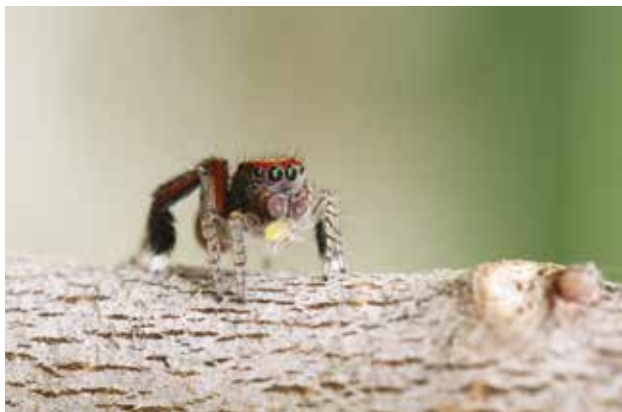
Saitis barbipes mâle (Araneae Salticidé) avec un jeune puceron, Le Barcarès (Pyrénées-Orientales) mai 2015