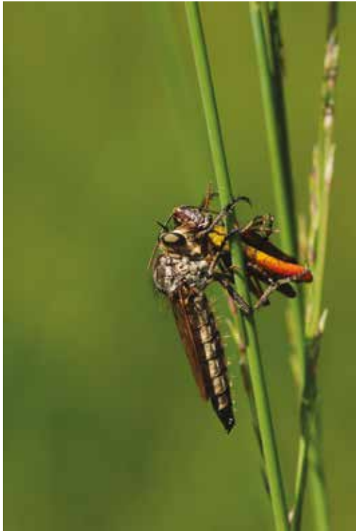
Un Asile (Dip. Asilidé) ayant capturé un Criquet noir-ébène ( Omocestus rufipes , Orth. Acrididé) en Forêt de Fontainebleau (Seine-et-Marne), août 2012