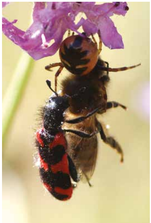
Une Araignée Napoléon ( Synema globosum , Araneae Thomisidé) et un Clairon des ruches ( Trichodes alvearius , Col. Cléridé) et une Abeille mellifère, victime de la première. Le Beausset (Var), juin 2014