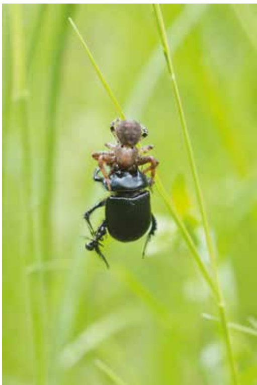
Une thomise (Araneae, Thomisidé) a capturé un Minotaure Typhée ( Typhoeus typhoeus , Col. Géotrupidé) mâle, avec une fourmi de passage... E.N.S des « Étangs de Narbonne » (Indre-et-Loire), mai 2013.