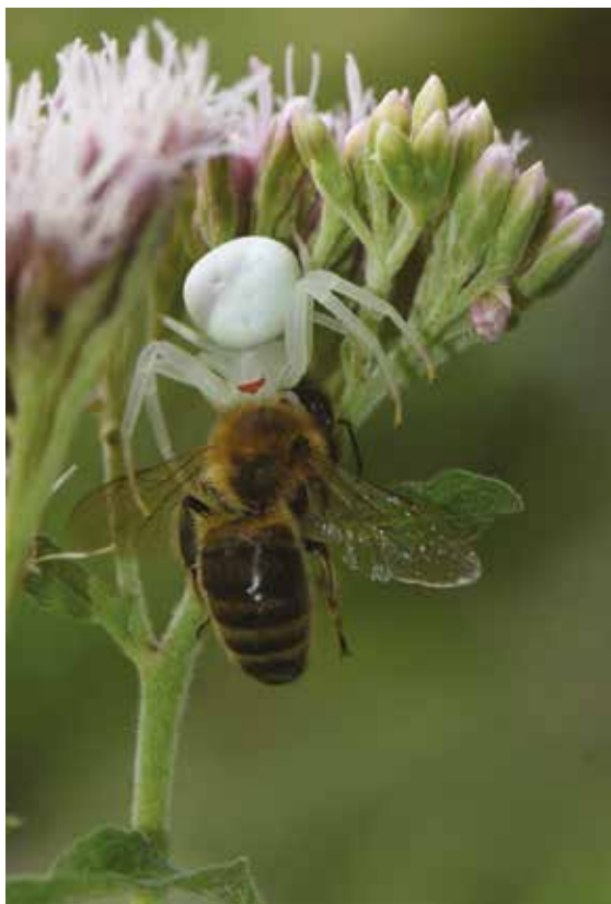
Une Abeille mellifère (Hym. Apidé) victime d'une Thomise variable ( Misumena vatia , Araneae Thomisidé) à Gréoux-les-Bains (Alpes-de-Haute-Provence), août 2017.