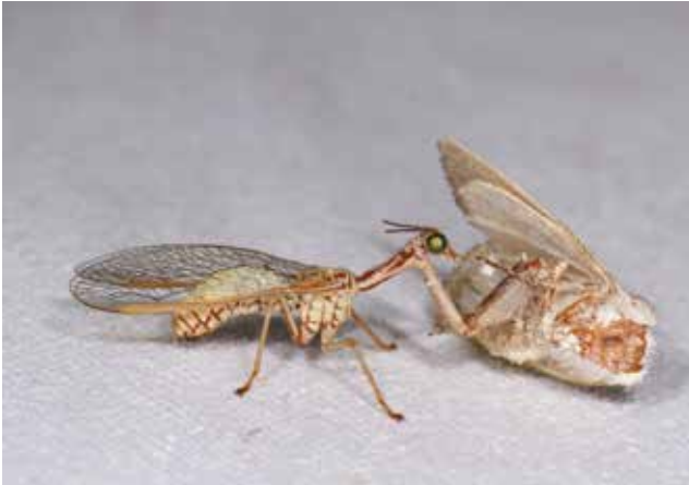
Mantispe ( Mantispa aphavexelte , Neur. Mantispidé) dévorant une noctuelle à Saint-Guilhem-le-Désert (Hérault), septembre 2018.