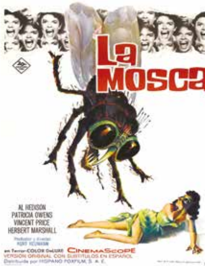
Affiche espagnole du film The Fly de K. Neumann, 1958