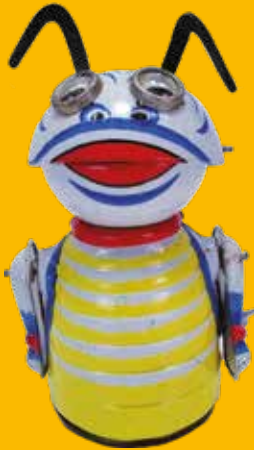
« Insecte robot de l'espace » : jouet mécanique à remontoir. © Marx toys, 1968.

Bêtes de pub : « Il va deux fois plus vite - comme Windex Spray pour nettoyer les fenêtres. »