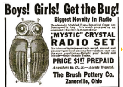
Réclame pour un récepteur radio insectoïde, 1928.

« Les hommes sont des insectes se dévorant les uns les autres sur un petit atome de boue. »