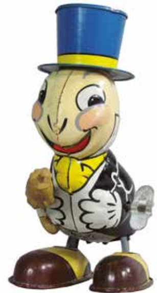
Jiminy Cricket : jouet mécanique à remontoir. © Line Mar toys, 1950.