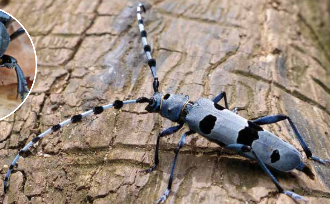
La Rosalie des Alpes - En médaillon, Biche, femelle de Lucane cerf-volant

Par Abigaïl Rabinovitch, Mathieu de Flores et Xavier Houard