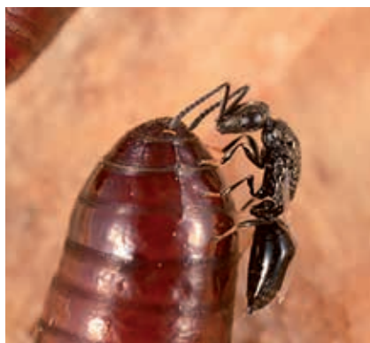
Guêpe parasitoïde ( Spalangia cameroni , Hym. Ptéromalidés) parasitant une puppe de Stomoxys calcitrans

ont été utilisés pour des recherches sur la biologie et l'écologie de ces mouches, quelquefois pour la lutte. Mais pour cette lutte, il était nécessaire d'avoir des systèmes les plus simples possibles et les moins coûteux. Aussi les collègues chargés de la lutte ont développé de simples écrans de couleur bleue et imprégnés d'insecticide pour contrôler les glossines. Ce sont ces écrans que l'on voit en Afrique le long des galeries forestières au bord des cours d'eau dans les foyers de maladie du sommeil. Cette technique a permis de bien contrôler cette terrible maladie dans nombre de foyers en limitant le nombre de mouches et les contacts humains-mouches.