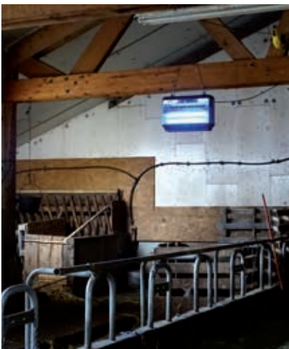
Piège Insectron (Abiotec) pour lutter contre les mouches à l'intérieur des bâtiments

Gérard Duvallet Université Paul-Valéry, UMR 5175 CEFE (Centre d'écologie fonctionnelle et évolutive), route de Mende, 34199 Montpellier Cedex 5 Courriel : gerard.duvallet@univ-montp3.fr