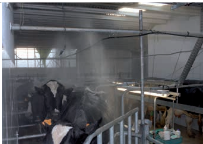
Ci-dessus et à droite, deux méthodes de lutte employées dans des élevages de la Réunion : piège Vavoua modifié pour la lutte et aspersion des vaches en salle de traite avec un mélange eau et hydrolat d'huile essentielle de géranium - Clichés G. Duvallet

en Afrique. Ils utilisent aussi des fils à colle disposés au-dessus des cornadis ou encore l'aspersion des animaux avec des mélanges d'eau et d'hydrolats d'huiles essentielles aux propriétés répulsives.