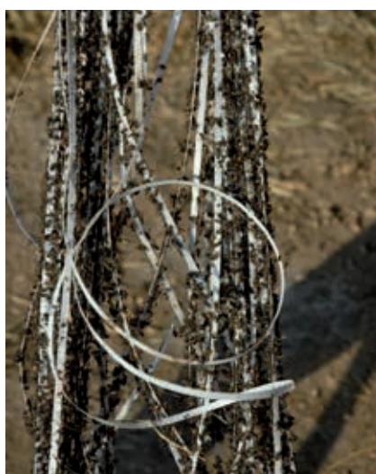
Retrait d'un fil à colle placé au-dessus des cornadis dans un élevage de La Réunion

tirées préférentiellement par le bleu, et particulièrement par le bleu phatologène. Parallèlement à ce piège Vavoua, de nombreux autres pièges ont été développés, en particulier le piège Nzi (depuis 2002) qui est apparu très efficace à la fois pour les stomoxes et les taons. Ces pièges