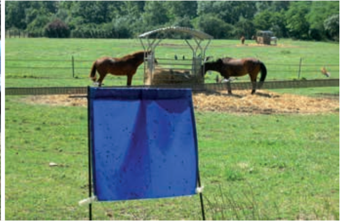
Ci-dessus, piège Nzi efficace pour taons et stomoxes. À droite, écran bleu en tissu, couvert de glu, pour capturer les stomoxes

d'écologie fonctionnelle et évolutive de Montpellier. Il s'agit pour chaque longueur d'onde de la lumière émise de mesurer la lumière réfléchi. Et l'on s'est aperçu que c'étaient les tissus ayant la réflectance la plus forte autour de 450-460 nm qui étaient les plus efficaces en termes d'attractivité et de sélectivité. Ces résultats sont conformes à ceux obtenus d'une recherche (en 2016) sur la manière dont les cellules visuelles des stomoxes répondent aux stimulations par des lumières de différentes longueurs d'onde. La sélectivité est également importante pour éviter de capturer trop d'insectes auxiliaires, en particulier des pollinisateurs. Dans des tests faits sur le campus de L'École vétérinaire de Toulouse avec des pièges Vavoua, nous avons constaté en 2013 que 16 pollinisateurs