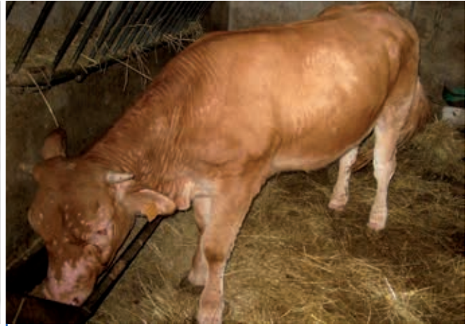
Génisse atteinte de besnoitiose bovine

moxes ont été évaluées à 2,2 milliards de dollars par an en 2012. Concernant les agents infectieux qui peuvent être transmis, on connaît, outre la bactérie du charbon déjà évoquée, des vers parasites des muqueuses de la lumière intestinale des chevaux (nématodes du genre Habronema ), des trypanosomes (protozoaires flagellés) en régions tropicales, mais aussi les agents de l'anaplasmose bovine (la rickettsie Anaplasma marginale ). Des recherches récentes menées à L'École nationale vétérinaire de Toulouse montrent que les stomoxes peuvent être aussi vecteurs mécaniques du protozoaire Besnoitia besnoiti . La besnoitiose bovine s'est répandue rapidement en France ces dernières années. Enfin, les stomoxes sont aussi recon-