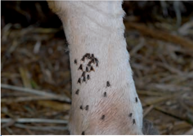
Patte d'un bovin charolais avec des stomoxes se gorgeant de sang