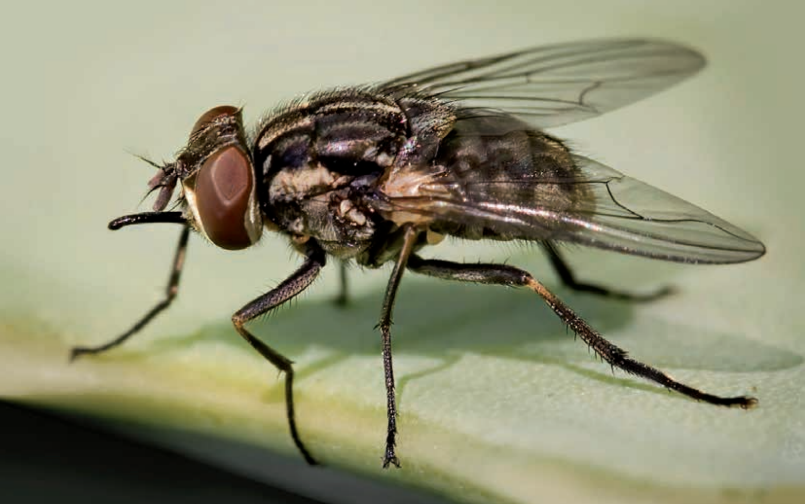
Stomoxys calcitrans