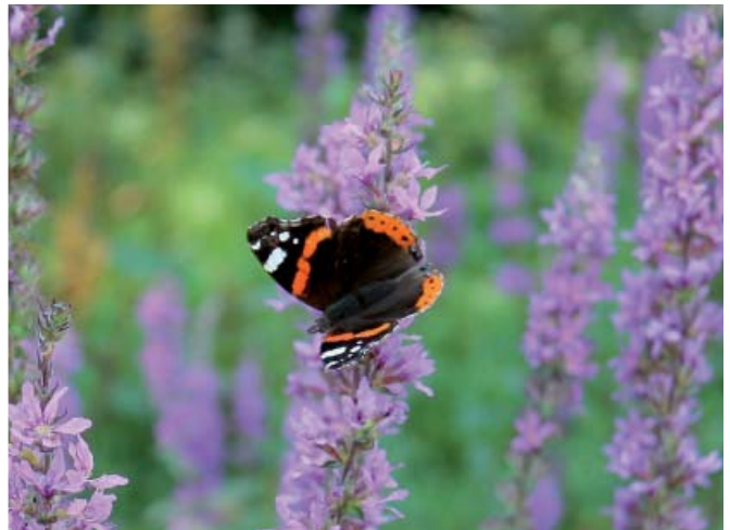
L'Azuré Porte-queue (ci-dessus), est migrateur rare en Mayenne contrairement au Vulcain dont certains individus hivernent dans le département.