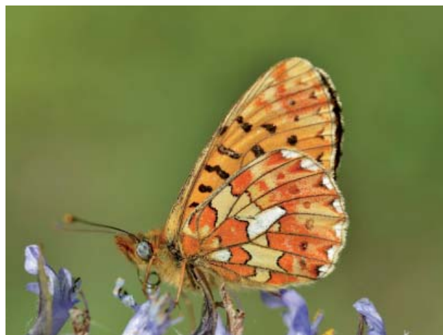
Le Grand Collier argenté, espèce « historique » en Mayenne.