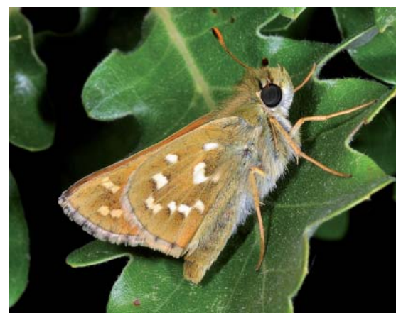
La Virgule

ments du Nord-Ouest. La Thécla de l'yeuse (9 obs. sur 8 communes) est une espèce sédentaire et discrète. Elle est difficile à détecter. Son effectif est probablement plus important que ne l'attestent les chiffres. Une recherche systématique des œufs ou des chenilles permettrait indubitablement de mieux détecter sa présence. La Mélitée de la lancéole (4 obs. sur 4 communes) semblait avoir disparu de la Mayenne depuis 1982 mais elle a été revue très récemment en 2013 et 2014.