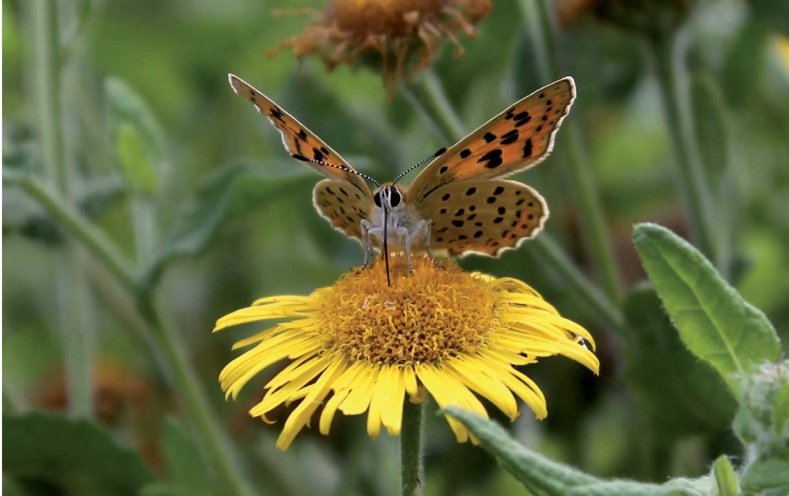
Le Cuivré fuligineux.