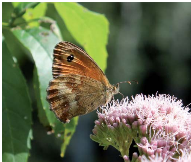
L'Amaryllis est l'une des 5 espèces de Rhopalocères les plus fréquentes en Mayenne.

la disparition du Damier de la succise (non revu depuis 1983) dont les chenilles se nourrissent des feuilles de la succise, plante plutôt inféodée aux prairies humides.