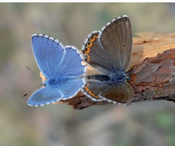
Accouplement d'Azuré bleu-céleste, une espèce non revue en Mayenne depuis le début des années 1980.

Les cinq espèces les plus communes appartiennent toutes à la famille des Nymphalidés. Ce sont le Myrtil (observé sur 256 communes), le Tircis (246), le Vulcain (245), l'Amaryllis (242) et le Paon-du-jour (241). Ces espèces sont également très communes en France.