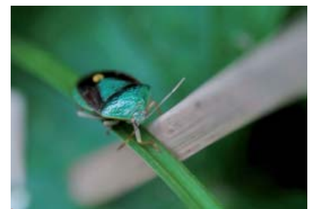
Edessa bifida .