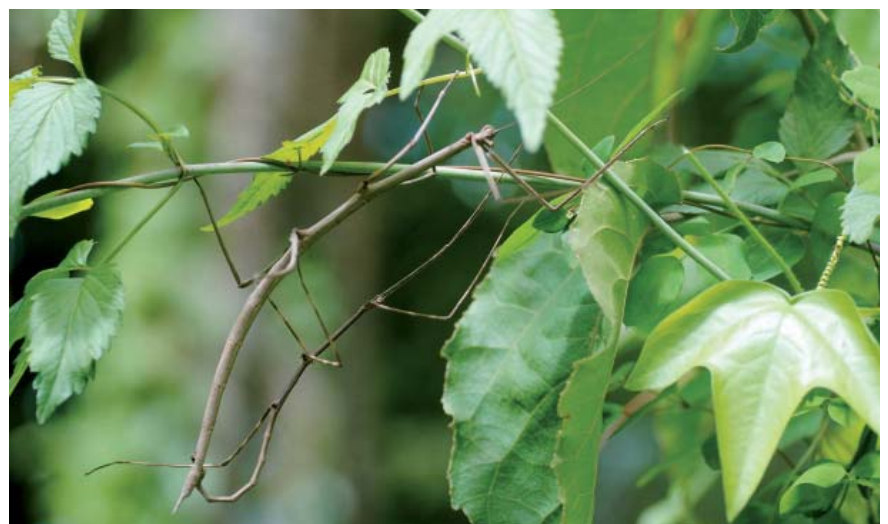
Accouplement de Paraphanocles keratoskeleton .

Il est toutefois difficile de rivaliser, en termes de déguisement, avec les phasmes (ou « chouval bon die » en créole) en forme de brindille qui se confondent aisément avec les rameaux des arbres. Il est plus aisé de les observer en forêt, la nuit, à la lumière d'une torche, lorsqu'ils se déplacent sur leurs plantes hôtes pour se nourrir et se reproduire. Ainsi, bien qu'aptères, les mâles de Paraphanocles keratoskeleton et de Clonistria , motivés par l'envie pressante de rencontrer une de leurs femelles, parcourent chaque soir de grandes distances à travers les forêts et les jardins pour assouvir leur désir.