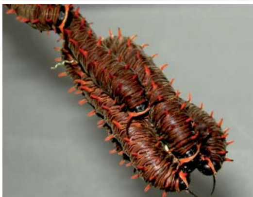
Ci-dessus, Battus polydamascebriones en train de pondre et ses chenilles.