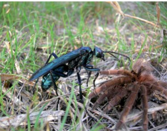
En haut, Vonvon femelle en pleine activité de butinage d'une fleur d'un « pois bâtard » ( Centrosema virginianum , Fabacée). En bas, une « Mouche brûlante » sur le point d'infliger à sa proie ( Acanthoscuria antillensis ) une piqûre paralysante.

par sa taille et la couleur bleu-noir métallique de son corps, passe une bonne partie des journées chaudes et ensoleillées à chercher au sol ces fameuses mygales qu'elle capturera pour nourrir ses larves.