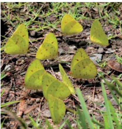
Piérides des jardins ( Phoebis sennae ) Cliché Eddy Dumbardon-Martial

Les taillis et les forêts sèches sont souvent occupés par la belle « Feuille morte » ( Memphis verticordia luciana , Lép. Nymphalidé) à peine visible dans la végétation et qui se délecte, durant les heures les plus chaudes de la journée, des exsudats de végétaux. Les clairières et prairies sont le point de rencontre de moult papillons diurnes de cou-