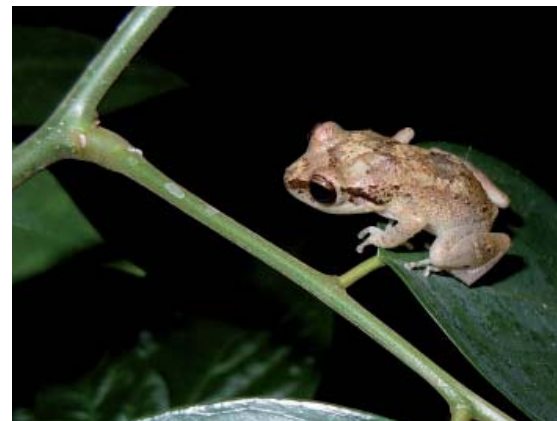
Hylode de Johnstone.

étages de la végétation et les milieux perturbés (naturellement ou non). Elle s'y nourrit principalement de fourmis mais aussi d'araignées et éventuellement d'autres arthropo-