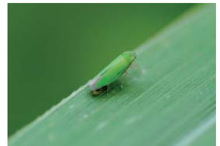
Hortensia similis .

Peut-être pour avoir de quoi préparer ces mixtures protectrices contre d'éventuels sortilèges (quimbois) largement utilisées autrefois dans les