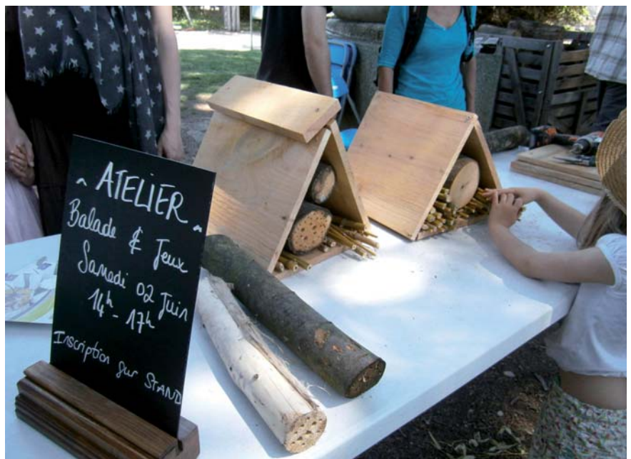
Atelier de construction de nichoirs et invitation à une balade à la découverte des abeilles sauvages

tion des professionnels et un guide des bonnes pratiques à destination des collectivités et des habitants 2 .