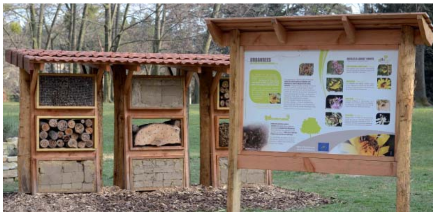
Sur certains sites (ici le parc de la Tête d'or en automne), des panneaux informent sur les occupants des hôtels

■ L'HÔTEL COMME OBJET SCIENTIFIQUE Le programme Urbanbees a ceci d'innovant qu'il teste de nouvelles approches de conservation. Entre 2010 et 2012, seize sites urbains et péri-urbains ont été aménagés dans le Grand Lyon et sa périphérie. Trois types d'aménagement favorisent la nidification des abeilles sauvages : des hôtels, des spirales à insectes et des carrés de sol. Pensés par un designer, les hôtels sont de grandes structures en bois remplies de bûches percées, de tiges creuses ou à moelle tendre, ou de terre. Pour répondre aux exigences écologiques de certaines espèces d'abeilles, différentes essences végétales y ont été testées (les bûches les plus appropriées semblent être : le sureau, le peuplier, le sophora et le platane, et pour les tiges : la canne de Provence, le bambou, l'ailante et le buddleia). La seconde structure, la spirale à insectes, est inspirée d'un modèle développé par des jardiniers anglais. Composé d'un muret de pierres monté en spirale et comblé d'une terre légère, sa disposition permet d'accumuler la chaleur et d'y cultiver des plantes aromatiques. Les fleurs et les interstices entre les pierres offrent gîte et nourriture à une multitude de petits animaux en un minimum d'espace. Mais les aménagements les plus novateurs sont enterrés. 70 % des abeilles sauvages nidifiant dans le sol, des espaces de terre nue délimités par