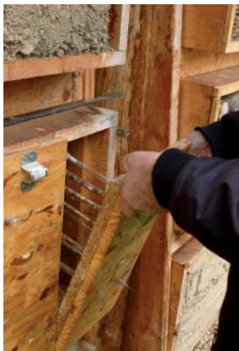
En haut, les tiges de bambou attirent de nombreuses osmies. Ci-dessus, Une bûche dont les trous sont operculés - Clichés Charlotte Visage - À droite un casier pédagogique permettant d'observer le développement des abeilles - Cliché Nicolas Césard

dénombrer près de 1 000 espèces en France dont l'Abeille domestique, 2 000 espèces en Europe et près de 20 000 sont connues dans le monde. Indispensables butineuses, leur richesse spécifique est la clé d'une pollinisation efficace. Or, leur déclin aura des conséquences importantes sur la biosphère et la vie des hommes, un tiers de notre alimentation et les trois quarts des espèces cultivées étant dépendantes de la pollinisation par les insectes. Le choix des villes pour le programme n'est pas anodin. Les milieux urbains et péri-urbains présentent de nombreux atouts pour les abeilles : on y trouve moins de pesticides que dans les zones d'agriculture intensive conventionnelle, la température qui y est légèrement plus élevée bénéficie aux abeilles pour la plupart thermophiles, les parcs urbains offrent une floraison abon-