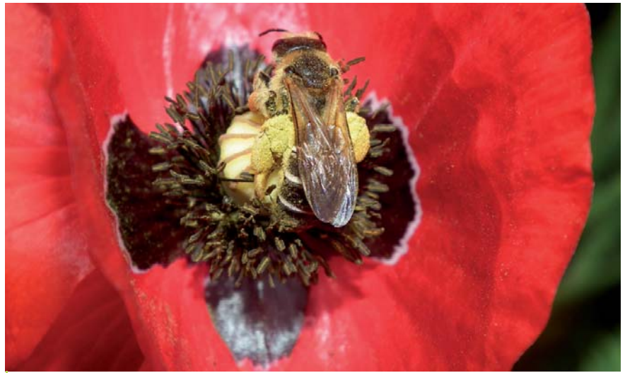
Un halicte sur une fleur de coquelicot