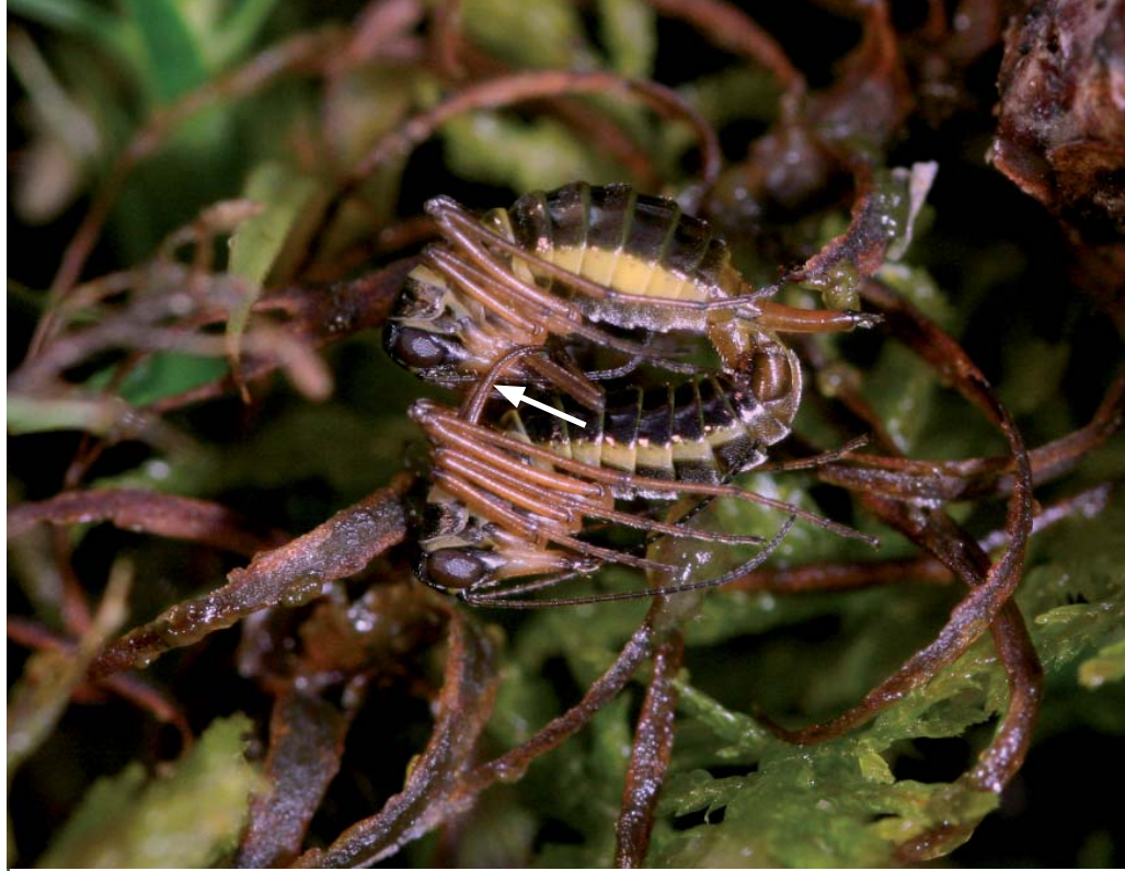
Accouplement de la Puce des neiges. La flèche montre la double paire d'ailes transformées du mâle enserrant le rostre de la femelle

La femelle, aptère et dotée d'un ovipositeur, se distingue aisément du mâle qui possède 2 paires d'ailes