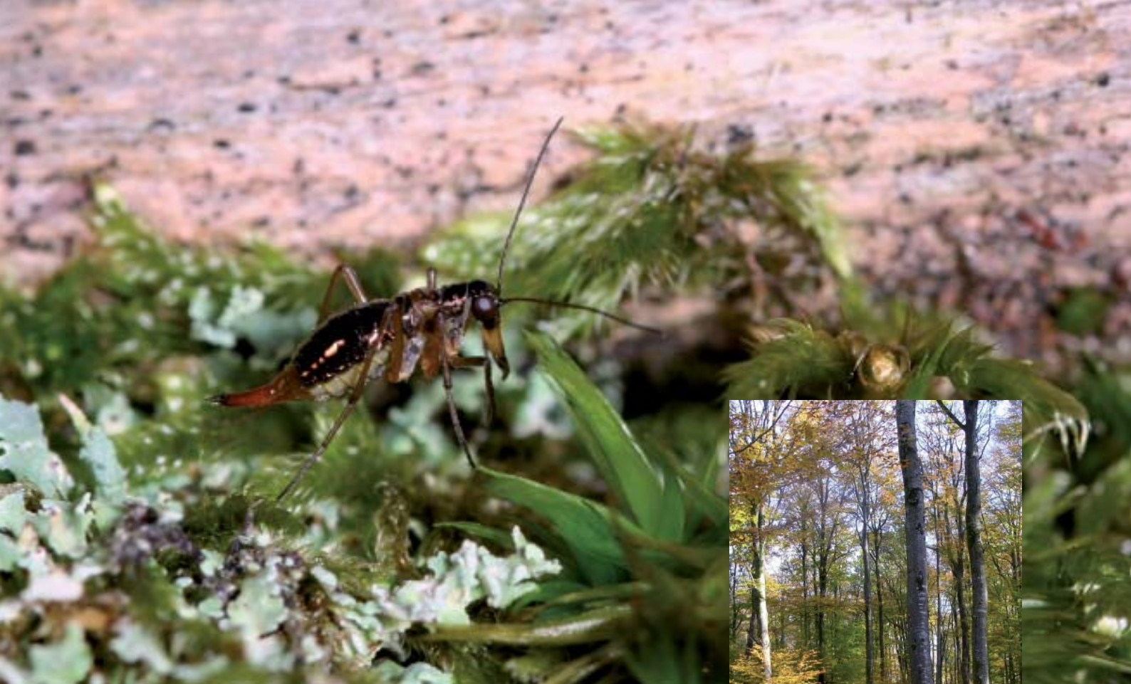
La Puce des neiges ou Borée possède le rostre caractéristique des Mécoptères. À droite, la hêtraie du plateau d'Antully, en Saône-et-Loire