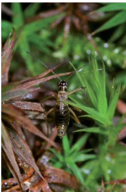
Mâle de Borée dans la mousse

L'arrivée des premiers froids sonne bien souvent l'heure de la diapause entomologique : filet et parapluie japonais regagnent le placard et l'entomologiste, espèce généralement univoltine, se réfugie dans son antre devant ses boîtes, sa binoculaire ou ses photos pour quelques mois. Pour une poignée d'autres (variété bivoltine ?), à l'inverse, la curiosité se réveille et s'aiguise alors que le mercure descend, avec une seule question en tête : « allons-nous le trouver cet hiver ? »