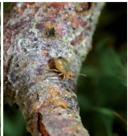
De gauche à droite : Grillon des bois, araignée-loup et collembole