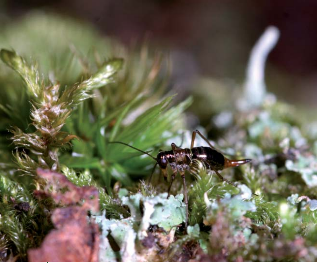
La femelle se reconnaît à son ovipositeur

certaine dose d'abnégation pour aller s'agenouiller de longues minutes – quand ce n'est pas plusieurs heures –, dans une position monastique sur le sol gelé, pour un long face-à-face méditatif avec le tapis de mousse en plein hiver ! La découverte du mythique Borée se mérite donc, sans jamais être acquise d'avance.