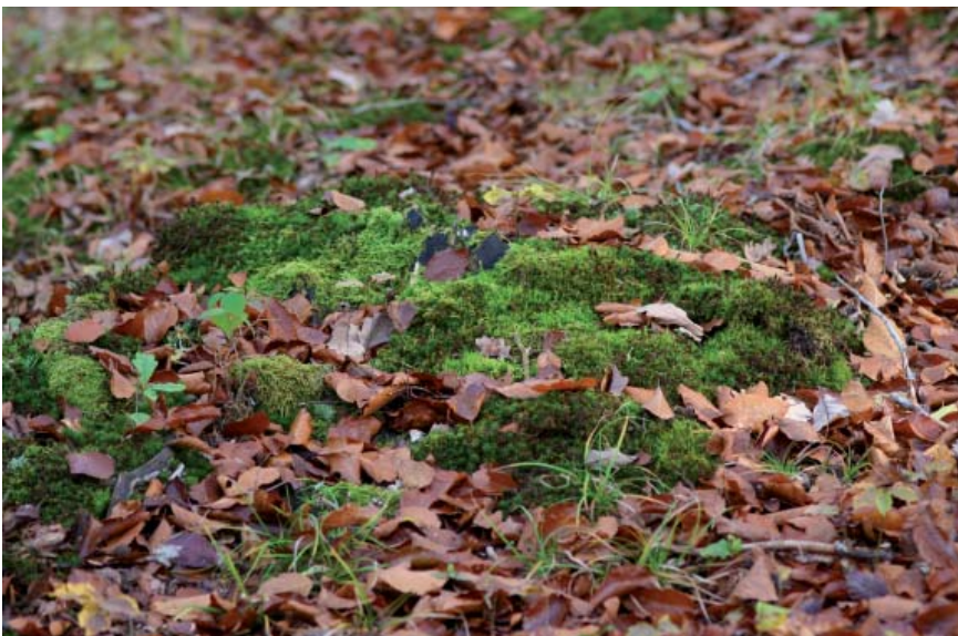
Coussin de mousses où ont été trouvés les premiers spécimens

de deux synthèses sur cet insecte publiées en 2008 et en 2011 dans L'Entomologiste , n'oublie jamais d'attiser la curiosité des uns et des autres et de marquer chaque automne le coup d'envoi de la saison, pour pousser entomologistes amateurs et confirmés à découvrir de nouvelles stations. Il apparaît ainsi que le Borée affectionne des sites à sous-sol sableux et à climat continental (voir la carte), et se trouve préférentiellement sur certaines espèces de bryophytes : Mnium hornum (majoritairement), Polytrichum sp. , Hypnum sp. , Dicranella heteromalla .