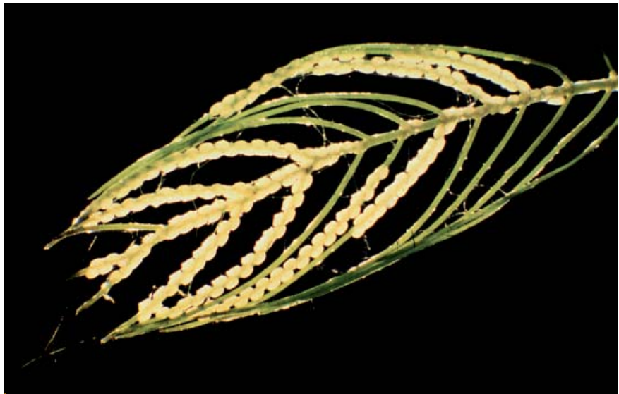
Ponte sur une feuille de myriophylle

tion de température trop importante les repousse dans les profondeurs. En fin de croissance – il y a 5 à 6 stades larvaires – et, si la nourriture est abondante, les chenilles ne mesurent guère que de 10 à 12 mm. Au travers du corps d'un vert presque transparent on distingue le cordon alimentaire plus sombre soulignant le tractus digestif. Leur comportement cryptique ajouté à leur petite taille et à leur couleur les rend difficiles à détecter dans la végétation. Au moment de la chrysalidation, la larve tisse un cocon, différent de la toile qui l'abritait auparavant. Cette installation a toujours lieu à près de l'apex soit, selon la plante-hôte, à une profondeur de quelques centi-