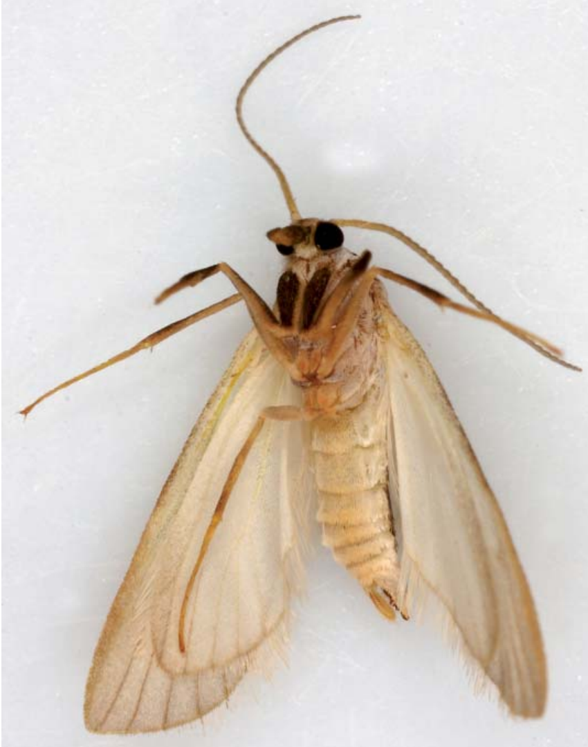
Mâle de l' Hydrocampe neigeuse, vu en position ventrale

férente, à droite et à gauche, pour un même individu. La durée de vie probable de ces femelles aquatiques est de 1 à 2 jours. Elles progressent habituellement en marchant sur la végétation. Au moment de l'accouplement, qui a lieu de nuit, elles s'approchent de la surface en nageant alors grâce à des rangées de soies disposées sur la face externe des tibias et des tarsi de la seconde et troisième paire de pattes. La paire de pattes antérieure, plus courte, ne prend pas part à la nage qui est rapide et saccadée.