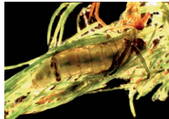
Deux chenilles de stades de développement différents dans la végétation

peut se passer 6 mois avant que la larve ne se nourrisse à nouveau, ce qui survient lorsque la température ambiante atteint un niveau suffisant, autour de 11 à 12 °C. ■