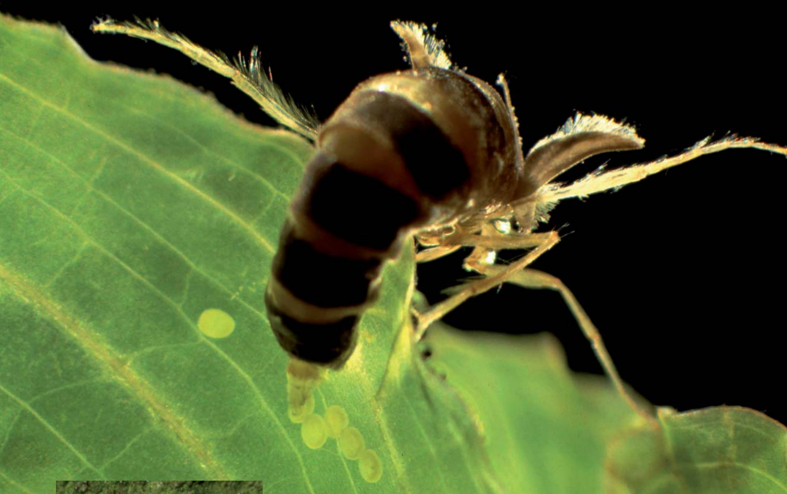
Femelle brachyptère de l' Hydrocampe neigeuse en train de pondre sur une plante aquatique. On distingue bien les ailes vestigiales ainsi que les soies natatoires sur la paire de pattes relevée.