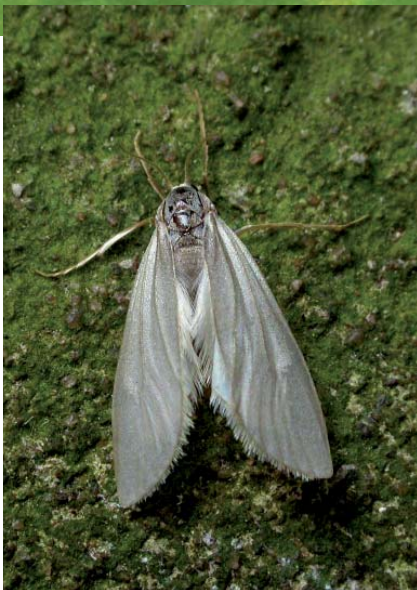
Mâle de l' Hydrocampe neigeuse

Quelques rares Lépidoptères appartenant à la famille des Crambides (ex-Pyralides), sous-famille des Nymphulines (= Acentropines), effectuent une partie de leur développement dans le milieu aquatique. Les chenilles naissent et se développent dans les eaux douces et stagnantes où elles se nourrissent de la végétation. Les adultes émergents sont aériens mais chez l' Hydrocampe neigeuse ( Acentria ephemerella ), la plupart des femelles sont seulement pourvues d'ailes rudimentaires et continuent de vivre sous l'eau.