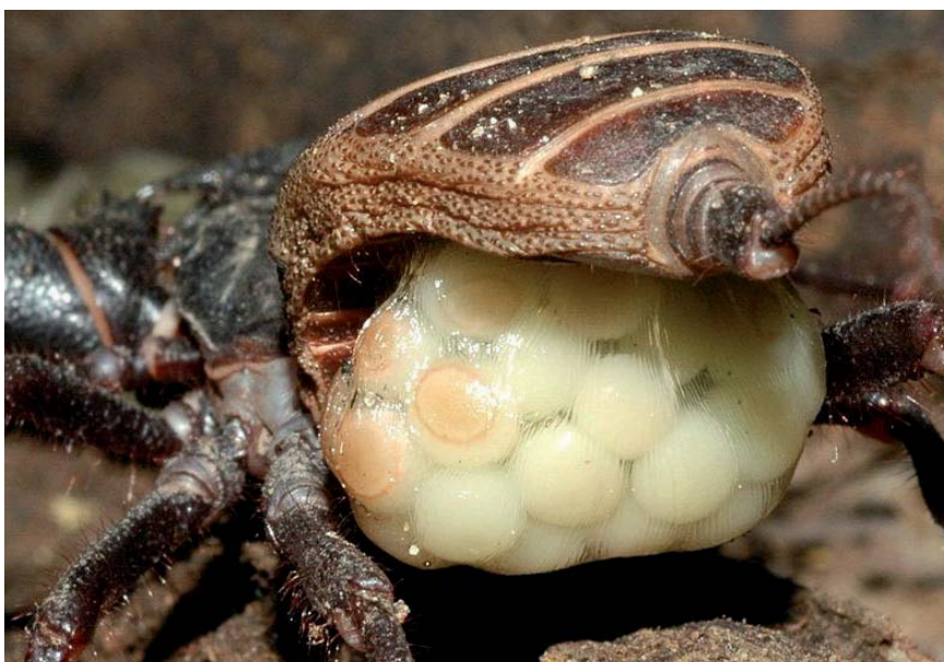
Femelle de Mastigoproctus giganteus avec son sac d'œufs suspendu sous l'abdomen