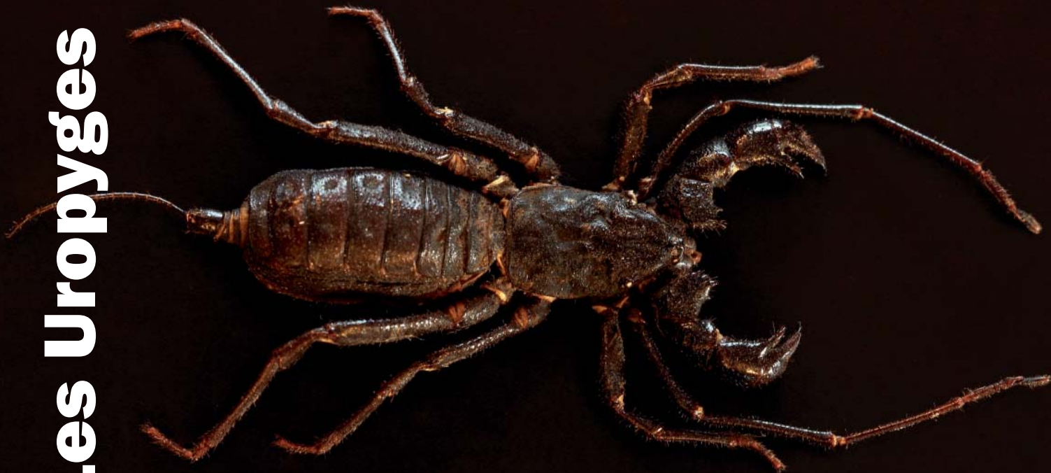
Typopeltis sp., collection personnelle de l'auteur

Arachnides primitifs, cousins souvent oubliés ou méconnus des araignées, les Uropyges sont de fascinants animaux apparus à la fin du Carbonifère (il y a environ 355 millions d'années) et demeurés tels quels. Leur allure atypique, leur méthode de défense peu commune et leur parade sexuelle hors du commun les rendent terriblement intéressants.