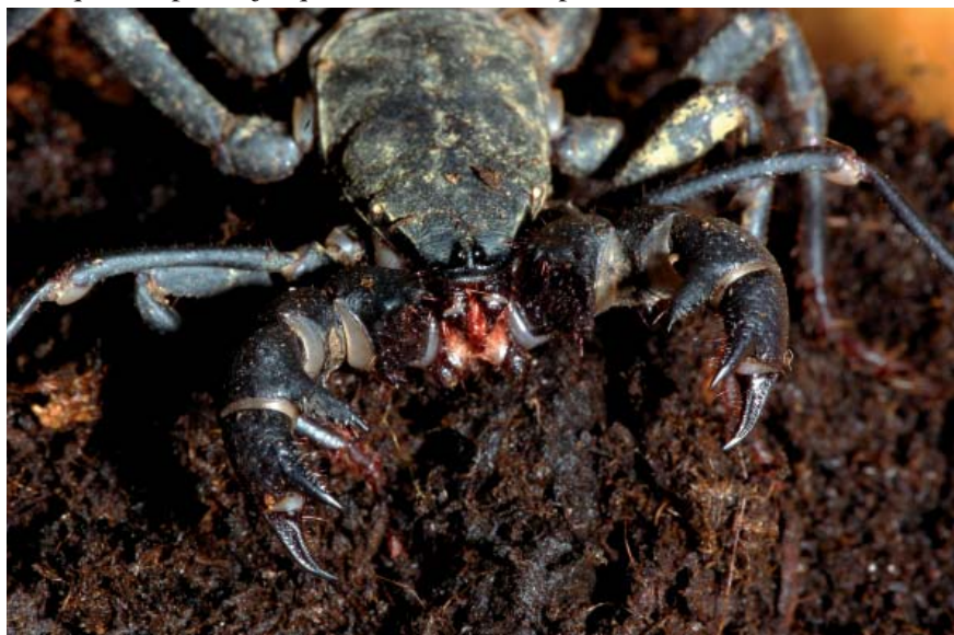
Typopeltis sp. vu de face, en captivité (Muséum de Wiesbaden, Allemagne)

première paire de pattes – dépourvue de griffes à l'extrémité – est modifiée en pattes antenniformes beaucoup plus longues que les autres, qui servent au repérage des proies ou à « tester » la nourriture ou l'eau, grâce aux nombreux poils sensoriels qui les recouvrent. Les 3 paires de pattes suivantes sont locomotrices. À l'arrière du corps, l'opisthosome est composé de 12 segments. Les deux premiers hébergent deux paires de poumons à lamelles et les trois derniers, très raccourcis, formant le pygidium, sont le lieu d'insertion de l'appendice caudal. Ce long flagelle, souvent agité de droite à gauche, renseigne l'animal sur les changements de