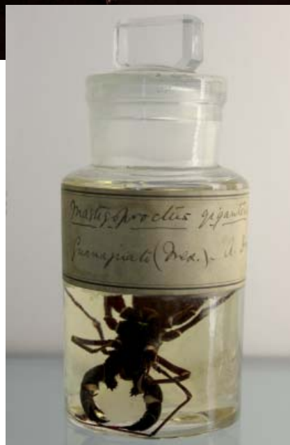
Mastigoproctus giganteus dans les collections du Natural History Museum de Londres

Les Uropyges ne possèdent pas de glandes à venin. Leur taille est comprise entre 25 et 80 mm. La