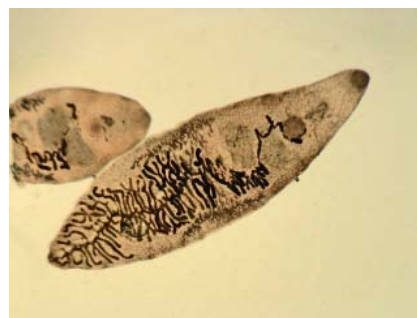
Petite Douve du foie

fait en sorte (le mécanisme n'est pas connu) que la fourmi grimpe au sommet d'une plante ou d'un arbre et s'y fixe par les mandibules. Le champignon achève la fourmi, en en dévorant le cerveau, puis fructifie au travers de sa cuticule, libérant des capsules qui explosent au cours de leur descente. Une spore atterrit sur la cuticule d'une fourmi et le cycle recommence 5 .