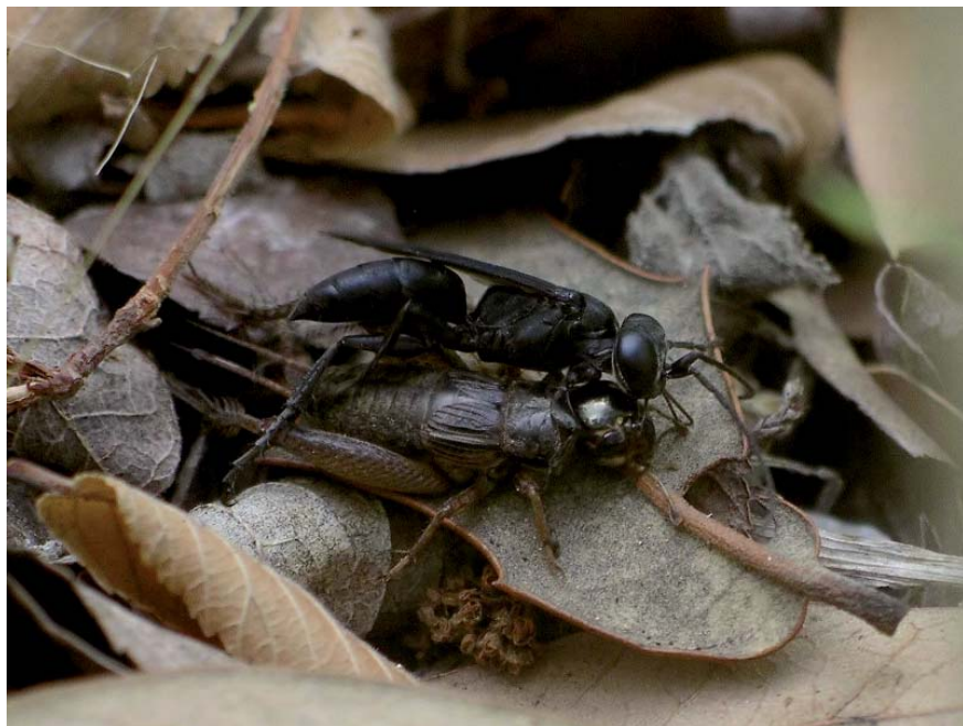
Liris niger ayant capturé et paralysé un grillon

qu'il est dévoré par la larve. Le grillon reçoit successivement 4 piqûres : dans le métathorax (probablement dans le ganglion nerveux), dans chacun des 2 autres segments du thorax puis, une fois bien calmé, dans le cou. La léthargie est très vraisemblablement due au blocage des canaux sodium.