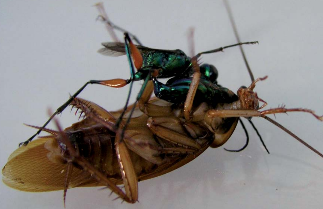
Ampulex compressa piquant une blatte dans le cou après l'avoir péalablement paralysée