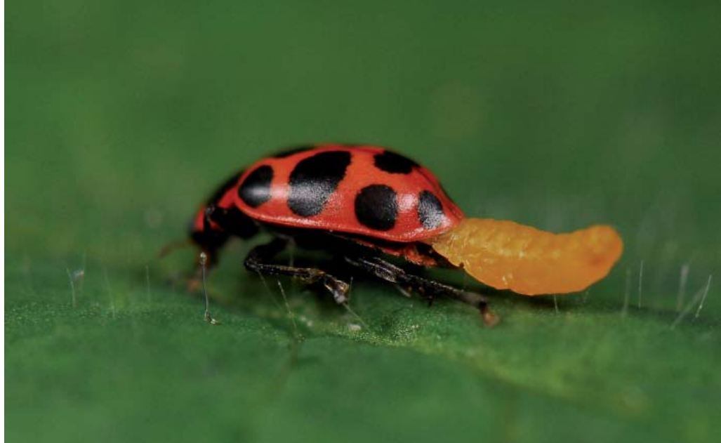
Sortie de la larve de Dinocampus coccinellae de l'abdomen de la coccinelle Coleomegilla maculata

Les parasitoïdes tuent leur hôte à la fin. Ce n'est pas le cas de Dinocampus coccinellae (Hym. Braconidé) qui ménage son hôte, la Coccinelle maculée Coleomegilla maculata 7 . La femelle pond un œuf dans la coccinelle ; la larve dévore une partie des organes de son hôte et sort se nymphoser dans un cocon tissé