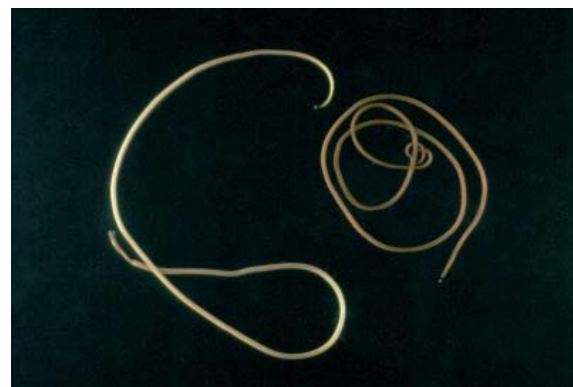
Le nématophore Paragordius tricuspidatus Cliché D. Andreas Schmidt-Rhaesa licence Creative Commons 3.0

Le gordien émerge alors de l'insecte. Si jamais celui-ci a été gobé, il s'extrait du prédateur par la bouche, les ouïes ou les narines... S'il est attaqué par une notonecte (punaise d'eau), il sort précipitamment. Mais