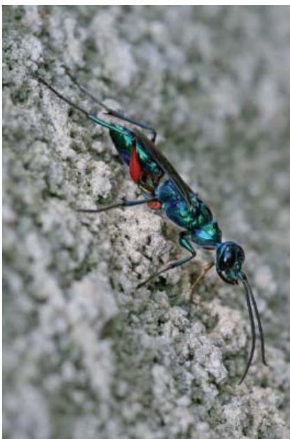
L'agent Chlorion comprimé

Un cas semblable et également bien étudié est fourni par un autre Sphécidé, Liris niger , qui a pour proie un grillon non fouisseur. La piqûre injecte un venin qui provoque une paralysie temporaire – durant laquelle il est traîné dans le terrier – puis une léthargie qui le maintient inerte – mais non paralysé – tandis