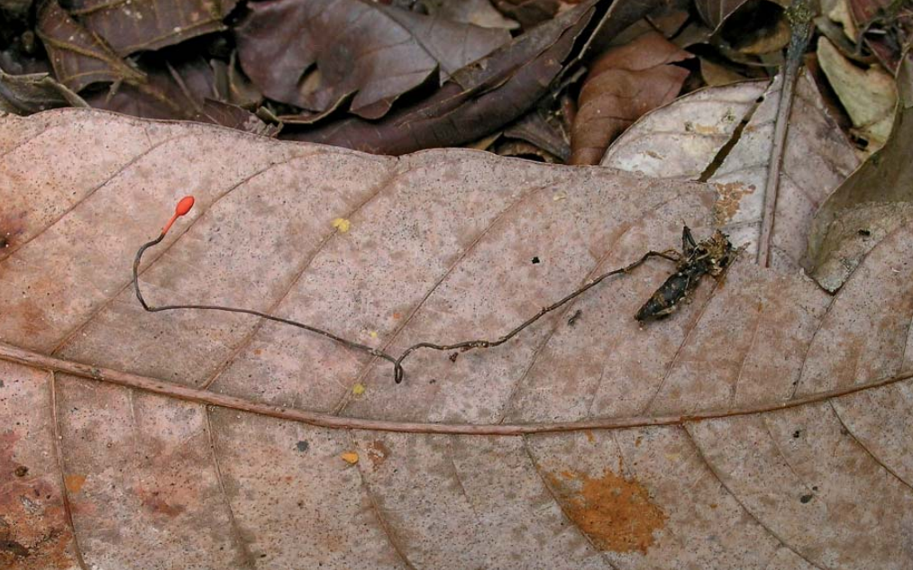
Insecte parasité par le champignon Ophiocordyceps australis (Bolivie)