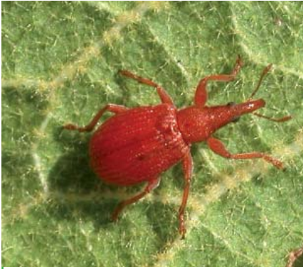
Apion de l'oseille