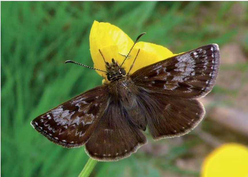
Le Point de Hongrie

lonies nombreuses, souvent mêlées, sous les pierres déposées par les agriculteurs le long des quelques haies qui subsistent sur le plateau. La capture d'individus isolés deux années de suite semble montrer qu'ils