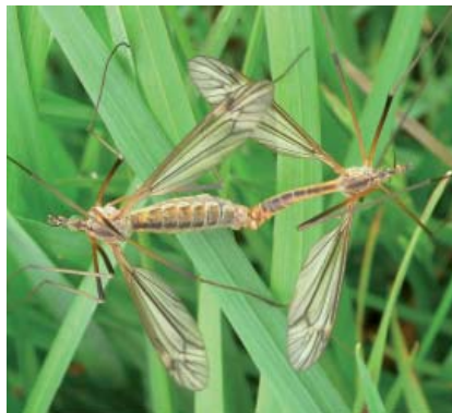
La Tipule printanière se reconnaît à ses beaux yeux verts