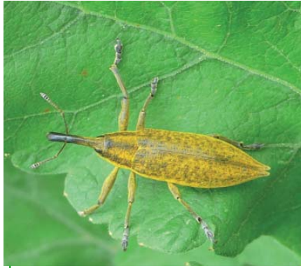
À gauche, Lixe des ombellifères, au corps mince et à l'extrémité des élytres en petite pointe divergente, à droite Lixe poudreux au corps plus massif et au bout des élytres arrondi