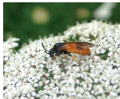
Tenthrede de la ronce