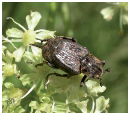
Cétoine à tarière femelle