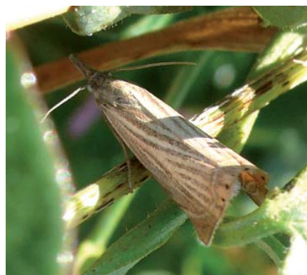
Crambus des jardins

courte période d'observation, mais je penche pour la plante relique plutôt que pour la plante pionnière.