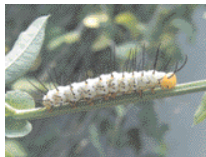
Chenille mature d' Heliconius melpomene