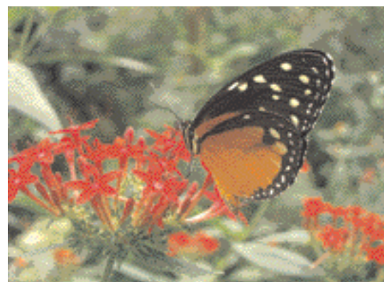
De haut en bas : Heliconius ismenius , Melinaea ethra et Tithorea tarricina (Costa Rica)