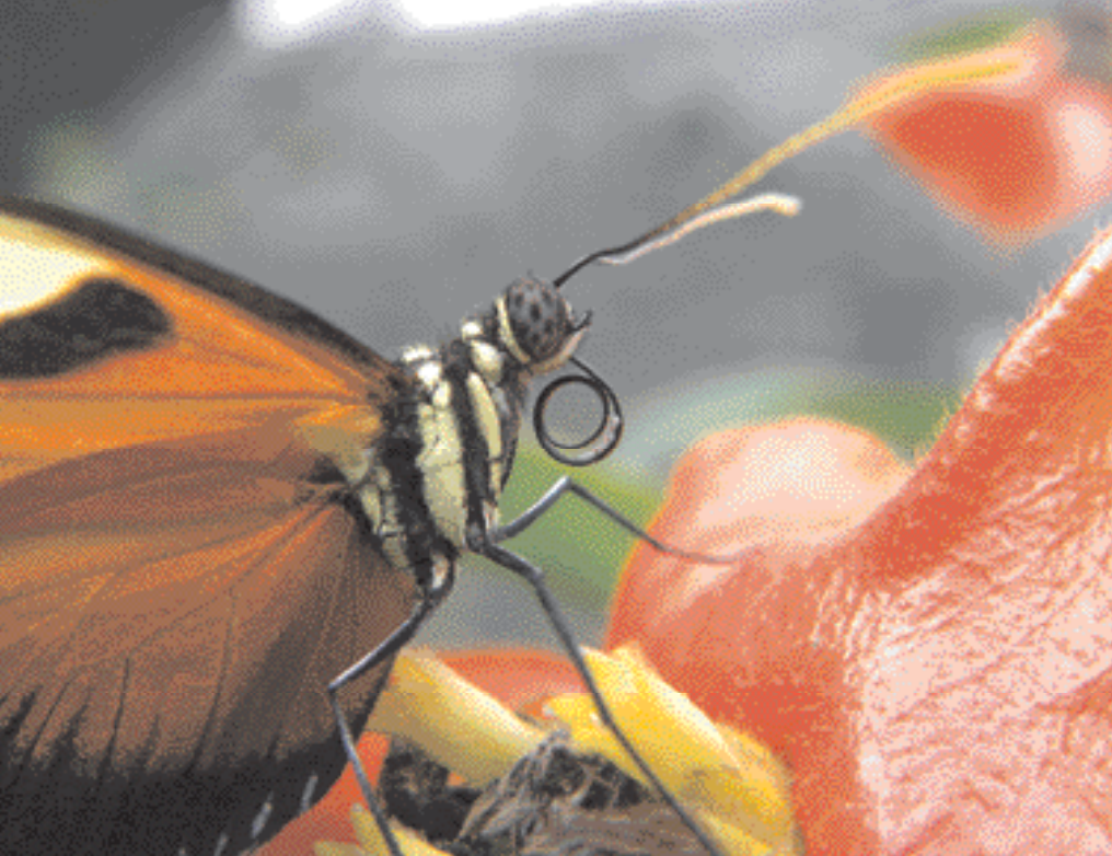
Adulte d' Heliconius hecale s'alimentant de pollen récolté sur sa trompe

ont la capacité d'utiliser les acides aminés présents dans le pollen en complément de ceux présents dans le nectar pour leurs besoins nutritionnels. C'est le seul cas de comportement actif et fortement spécialisé de recherche de pollen qui a été démontré.