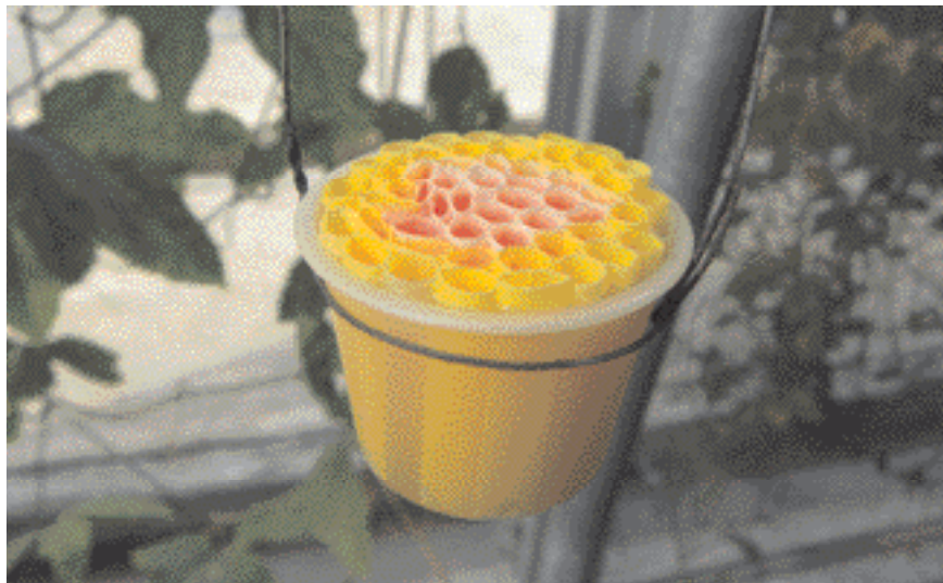
Un dispositif utilisé pour nourrir les papillons à partir d'un mélange d'eau, de sucre et de pollen dilué. L'élevage des est aisé sous serre dès lors qu'on respecte les conditions de température et d'hygrométrie, leurs plantes-hôtes ayant une croissance rapide et demandant peu d'entretien. À l'état adulte, il est facile de les capturer à la main et de les marquer.

Quelques laboratoires, dont une équipe du Muséum national d'histoire naturelle de Paris (MNHN), travaillent aujourd'hui sur ce modèle dans le but d'étudier et de découvrir les mécanismes des changements génétiques à l'origine de l'adaptation biologique. Les recherches visent à comprendre com-