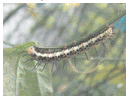
Chenille mature d' Heliconius erato

sur leur périphérie, attire un grand nombre de fourmis. En retour, cel-