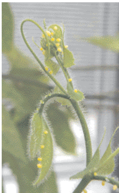
Ponte groupée d' Heliconius hecale en élevage