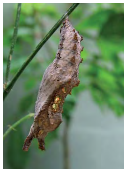
De gauche à droite : chrysalide d' Heliconius hecale, chrysalides d' Heliconius erato et de Dryadula phaetusa