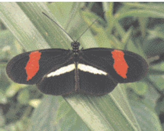
Heliconius melpomene et H. erato (Costa Rica)

les-ci protègent la plante nourricière contre les attaques en éliminant notamment les œufs et les jeunes larves d' Heliconius . Afin d'échapper à cette prédation, les œufs sont généralement déposés individuellement à l'apex des tiges et des vrilles de la plante, voire, selon les espèces, sur la face supérieure ou inférieure des feuilles. Malgré cela, la prédation reste importante. L'œuf éclot au bout de quelques jours et les chenilles nouveau-nées s'attaquent d'abord aux jeunes organes de la plante (feuilles, tiges, vrilles) qui sont plus tendres. Au dernier stade, les chenilles peuvent consommer plusieurs feuilles âgées par jour et donc défolier assez rapidement une tige entière de leur plante hôte. Elles se tiennent toujours sous les feuilles, à l'abri des intempéries et hors de vue des prédateurs.