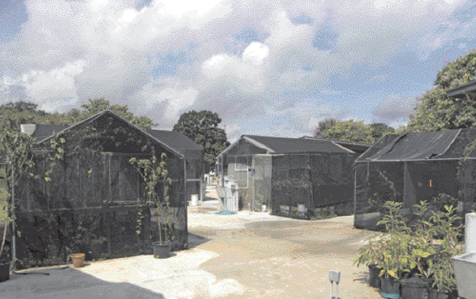
Serres d'élevages d' Heliconius , appartenant au STRI, sur le site de Gamboa au Panama.