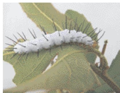
Chenille mature d' Heliconius hecale

Selon l'espèce, les œufs sont pondus isolément ou en groupe. La présence de nectaires – glandes sécrétant un liquide nutritif sucré – à la base des feuilles des passiflores ou