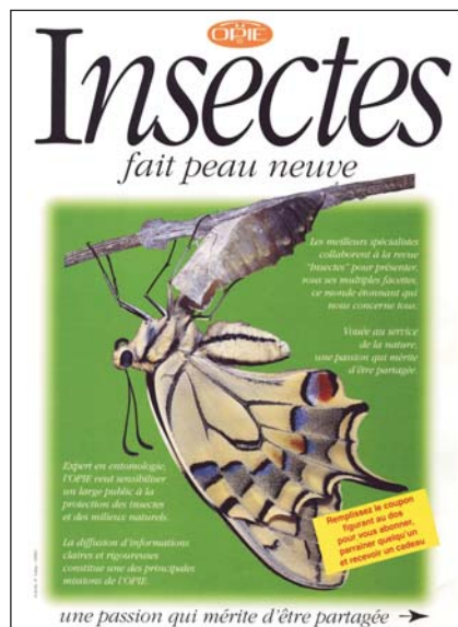
Cette page promotionnelle accompagnait la 3 e de couverture du n°100