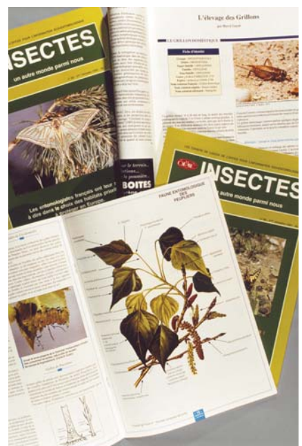
Insectes « série verte » (n°68 à 99)