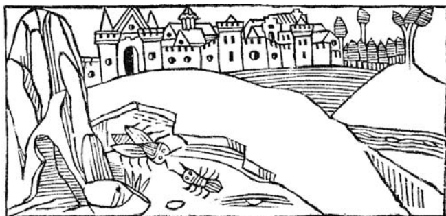
Fig. 3 – La mouche et la fourmi, édition de Burgos, 1496, 11 x 5,5 cm