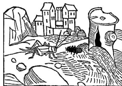
Fig. 2 – La fourmi et la cigale, édition de Strasbourg, ca 1481, 9 x 7 cm

autre publication, ils ont aussi mis le nez dehors pour s'inspirer de la nature. Contrairement au sculpteur de Vézelay, leurs dessins sont assez corrects au point, pour certains, de permettre de reconnaître avec une bonne probabilité l'espèce qui a servi de modèle.