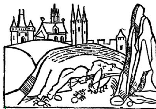
Fig. 1 – La mouche et la fourmi, édition de Strasbourg, ca 1481, 9 x 7 cm

Que retenir de tout cela ? Primo , si les deux graveurs ont en partie réutilisé leurs vignettes en copiant une