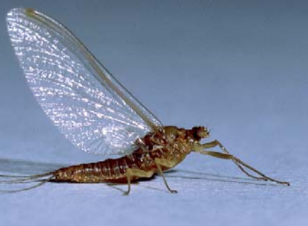
Imago femelle

Les pêcheurs à la mouche la connaissent comme Ephemerella ou Olive à ailes bleues. Ils l'apprécient comme appât et, de juin à septembre, la surveillent, de la "nymphé" rampante au fond de l'eau courante au "spent" rouge dérivant. Voici son portrait entomologique détaillé.