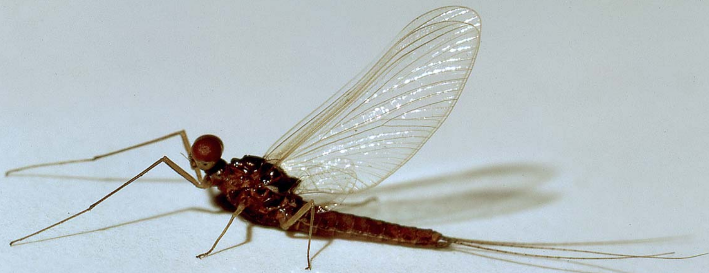
Imago mâle reconnaissable à ses yeux très développés