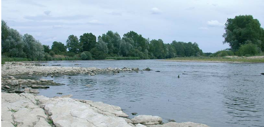
Un exemple de cours d'eau à Serratella (affleurement calcaire du Bec d'Allier)