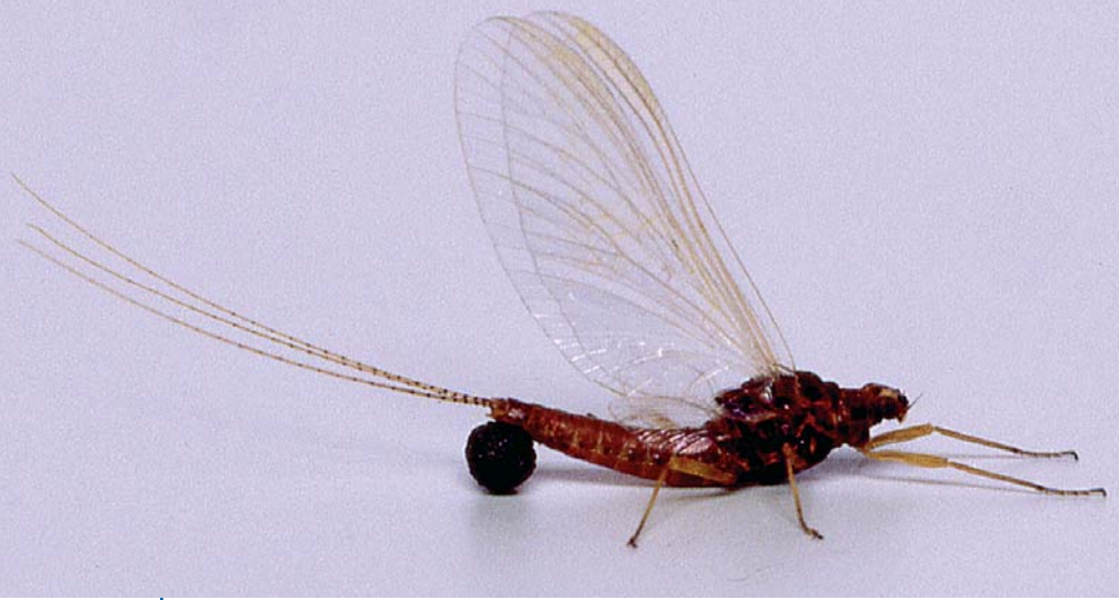
Imagette femelle et sa masse d'œufs qu'elle larguera en une fois au-dessus de l'eau

rieur, de chaque côté de la médiane, une forte saillie en plus des processus latéraux dirigés vers l'arrière. Les tergites III à VII portent une paire de trachéobranches en position dorso-latérale, chaque branche recouvrant plus ou moins la suivante. S. ignita se distingue des autres Éphémérellidés par la forme des branches relativement pointues. L'abdomen est prolongé par trois filaments caudaux, cerques et paracerque, garnis de soies raides, annelés avec alternance de deux anneaux sombres et de deux anneaux clairs. La coloration d'ensemble est brunâtre avec des mouchetures sombres plus ou moins marquées, en particulier sur les pattes. On constate que les individus des stations d'altitude sont plus petits et plus fortement colorés que ceux des stations de plaine (respectivement 6 et 8 mm). On remarque toutefois une grande variabilité de la pigmentation au sein d'une même population. Les larves de tous les Éphémérellidés prennent une attitude particulière quand elles sont dérangées : abdomen et cerques sont dressés à la verticale du corps, évoquant ainsi la défense du scorpion. La larve se nourrit essentiellement de diatomées récoltées sur les supports qu'elle fréquente. Sur la larve de dernier stade, appelée abusivement « nymphe », les sacs alaires prennent une coloration noirâtre caractéristique. Le sexe de l'insecte peut alors être déterminé grâce aux ébauches des organes génitaux,