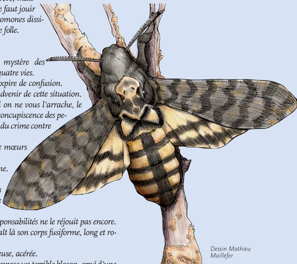
Dessin Mathieu Maillefer

Il sera donc comme l'ont décidé les savants, Acherontia atropos , le Sphinx tête-de-mort. Alors d'un terrible coup d'aile, traversant un nuage d'une abominable noirceur, il rejoint les enfers, les trois filles de la nuit et celle de son destin.