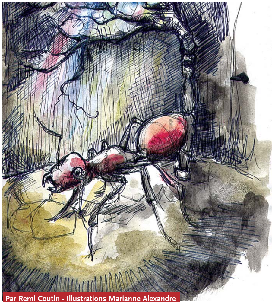
Par Remi Coutin - Illustrations Marianne Alexandre