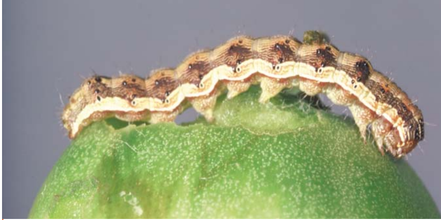
Dans les pays tempérés, la Noctuelle de la tomate ( Helicoverpa armigera ) hiverne à l'état de chrysalide enfouie dans le sol, à plusieurs centimètres de profondeur. Cette espèce est un migrateur notoire très polyphage dont les dégâts provoqués dans les cultures sont parfois spectaculaire (été 2003 en France par exemple).