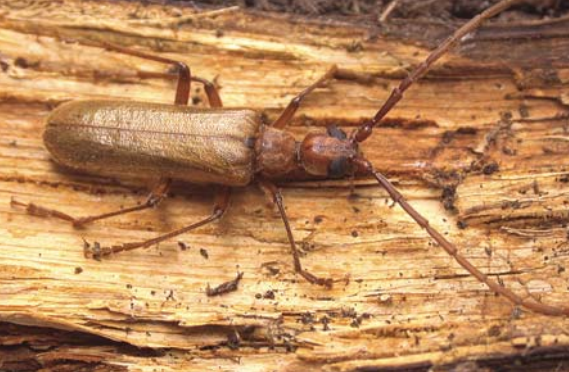
Le Vespère stridulant ( Vesperus strepens ) a pratiquement la même biologie mais son aire de répartition concerne essentiellement la Provence.

Les grosses larves de la Vespère de la vigne, ou Mange-mallol ( Vesperus xatarti ), sont friandes des racines de nombreuses plantes. Elles vivent assez profondément en été et en hiver, et remontent au printemps et à l'automne.