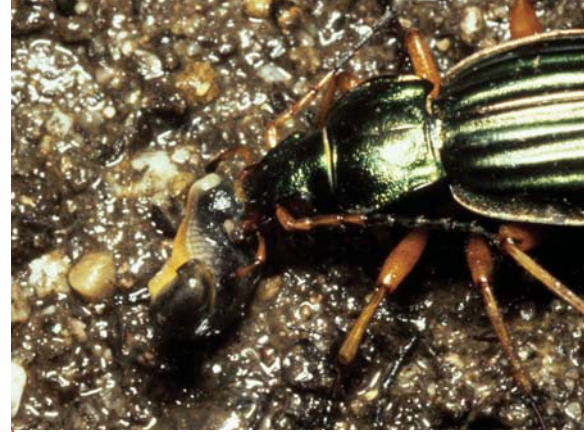
La Jardinière ou Carabe doré, Carabus auratus , prédatrice des limaces, est un précieux auxiliaire du jardinier.

les tubercules de pomme de terre. Les Carabidés du genre Zabrus sont également phytophages à l'état larvaire comme à l'état adulte, ce qui est une exception dans le groupe. Les larves de Zabrus tenebrionides creusent des galeries dans le sol. Nocturnes, elles en sortent la nuit pour dévorer le parenchyme des feuilles, causant des dégâts caractéristiques dans les champs de céréales.