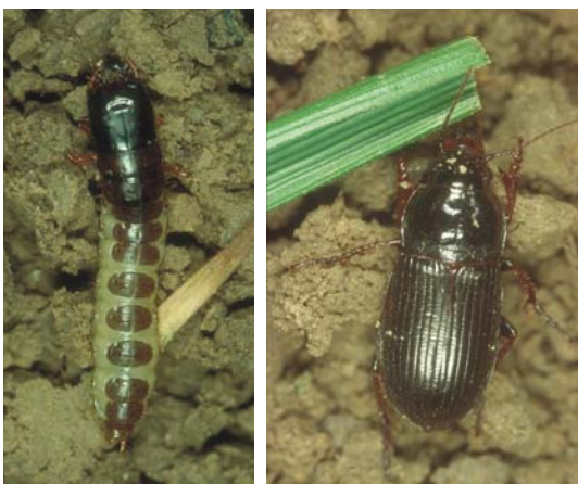
En France, larves et adultes du Zabre des céréales ( Zabrus tenebrionides ) sont régulièrement responsables de gros dégâts dans les jeunes semis des céréaliculteurs.