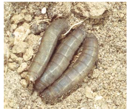
Larves de la Tipule des prairies

stades ultérieurs, peuvent s'attaquer aux racines des plantes céréalières. Une autre espèce courante est la Mouche de la Saint-Marc ( Bibio marci ), dont les larves fréquentent les sols humifères forestiers. Les pêcheurs, à qui elles servent d'esches, les connaissent bien. Les larves de Tipulidés sont également terricoles et appréciées comme appâts ; au Québec on les