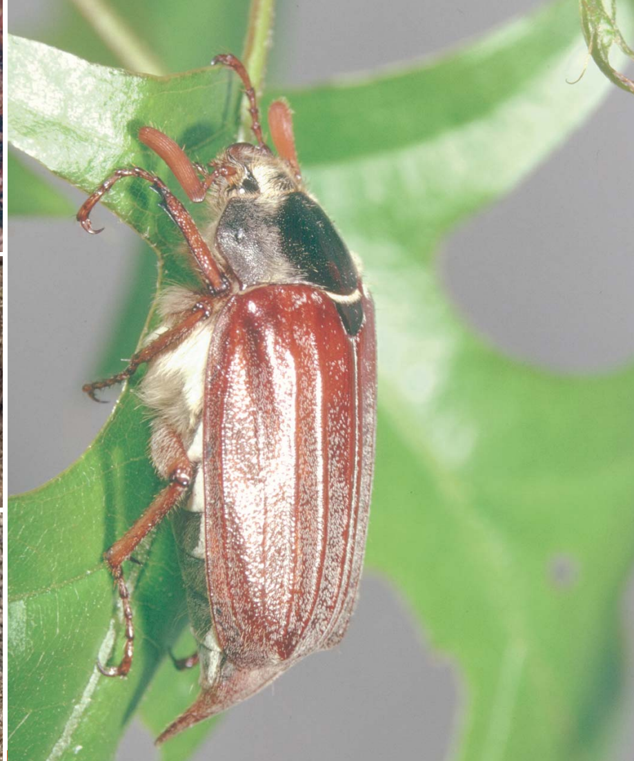
Œufs, larve, nymphe et adulte du Hanneton commun ( Melolontha melolontha )