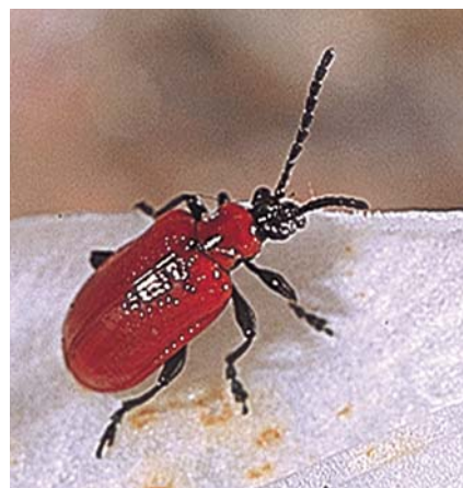
Le Criocère du lis ( Lilioceris lili ) est un petit Chrysomélidé spécialisé dans la consommation de feuilles de Liliacées. Sa larve se nymphose dans le sol, dans un cocon souple enrobé de terre.