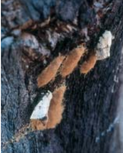
La ponte débute dès la fin de l'accouplement, le plus souvent sur le tronc même où les femelles ont émergé de leur chrysalide. La femelle au premier plan redresse son abdomen pour libérer dans l'air sa phéromone sexuelle.