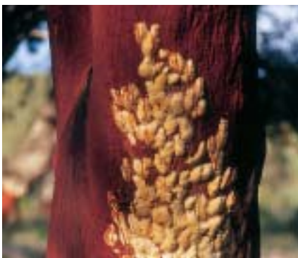
De très nombreuses pontes ont été déposées sur ce tronc fraîchement démasclé. Après une défoliation totale, le risque de mortalité est très faible sauf lorsqu'un chêne-liège est déliéé juste après avoir été défolié.