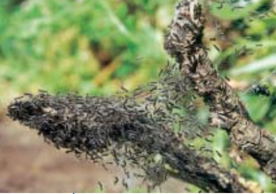
Les chenilles nouvellement nées, douées d'un fort phototropisme, se retrouvent aux extrémités des rameaux pour consommer les jeunes pousses. Trop nombreuses, elles seront dispersées par le vent, parfois sur plusieurs dizaines de kilomètres.