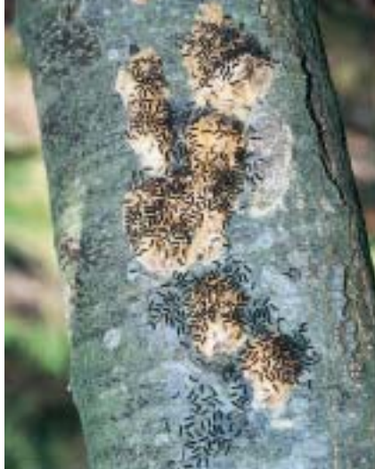
Vers la fin mars, après neuf mois en arrêt de développement dans l'oeuf, les jeunes chenilles éclosent de façon très synchronisée.