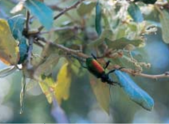
Les reflets scintillants des Calosomes adultes signalent la présence dans les arbres de nombreuses chenilles à consommer.