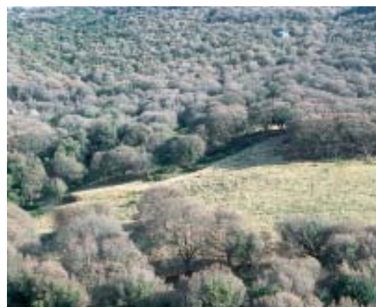
La défoliation totale des arbres, parfois sur des milliers d'hectares, s'apparente pour une courte période seulement aux dégâts causés par un incendie.

défoliés débourent normalement l'année suivante et offrent alors un feuillage favorable à la nouvelle génération de chenilles. Un tel scénario pourrait s'être produit dans le secteur de Palombaggia au sud de Porto-Vecchio où des traitements localisés ont été réalisés en mai 2001 et 2002. Après les très fortes défoliations observées les deux années précédentes dans l'ensemble de la région, seul le secteur de Palombaggia a présenté des aires défoliées en 2003. Partout ailleurs, les ennemis naturels et l'absence de débourement des arbres ont joué un rôle décisif favorisant la disparition de la quasi totalité des chenilles sans qu'aucun traitement n'ait été