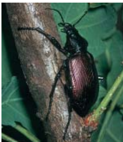
Le Calosome est le prédateur le plus remarquable que l'on puisse trouver après quelques années de pullulation. En un mois d'activité, chaque adulte peut tuer plus de deux cents chenilles. - Cliché R. Coutin-OPIE

la quasi disparition de leur proie principale. De telles pullulations du Calosome sycophante ont été déjà signalées en Corse en 1955 et en 1974. Dans beaucoup de pays d'Europe comme en Sardaigne, les chenilles du Bombyx disparate affaiblies par la famine sont attaquées par le virus de la polyédrose nucléaire de Lymantria dispar . C'est le développement de la maladie qui entraîne alors l'achèvement brutal des pullulations, comme on l'a constaté en forêt de Fontainebleau en 1994. Mais ces épizooties n'ont jamais été observées ni en Corse ni au Maroc.