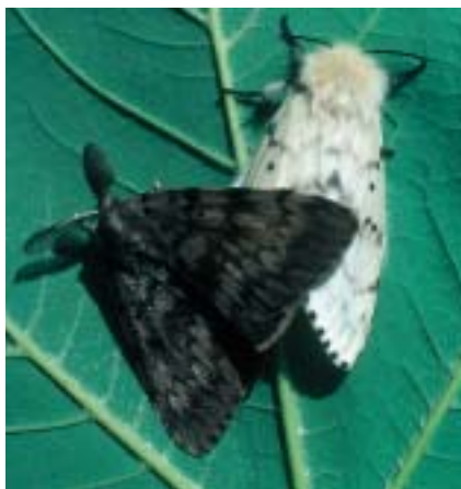
Accouplement. Femelle et mâle ne peuvent pas se confondre.

Le Bombyx disparate ( Lymantria dispar ), papillon de la famille des Lymantriidés doit son nom au grand dimorphisme sexuel des adultes. Le mâle brun, svelte, aux antennes bipectinées, vole bien, tandis que la femelle, blanche et à l'abdomen volumineux, ne vole pas. On l'appelle aussi Zig-zag en référence au tracé noir en zig-zag de ses ailes ou encore Spongieuse à cause de ses pontes semblables à de petites éponges de couleur chaamois, de 3 à 4 cm de long. La chenille très poilue qui porte deux gros tubercules pileux de part et d'autre de la tête est appelée Chenille à oreilles ou encore Lagarta peluda en Espagne et au Portugal. Elle est aussi le Gypsy