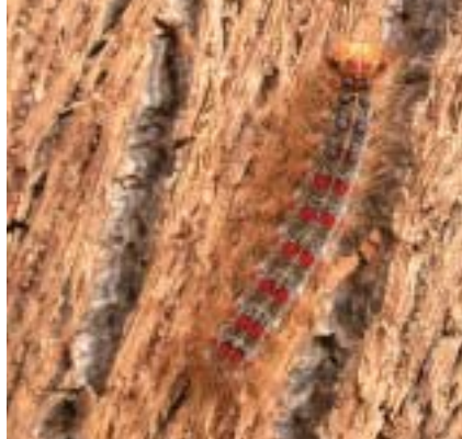
Chenille au 5 e stade de son développement sur l'écorce d'un chêne-liège

sion des œufs. Après une défoliation totale, les arbres refont un nouveau feuillage au bout d'un mois mais les chênes à feuilles persistantes ne débourent pas l'année suivante. Les chenilles qui doivent alors se nourrir de feuillage âgé se développent mal et donnent des papillons déficients dont la descendance est peu nombreuse, ce qui favorise l'effondrement des populations.