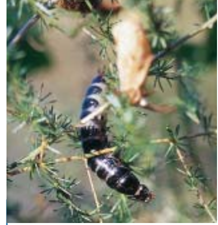
Les larves du Calosome sont les pires ennemies des chenilles et des chrysalides. Avec leurs puissantes mandibules et leur corps noir rempli de graisse, elles font souvent encore plus peur aux humains que leurs proies.