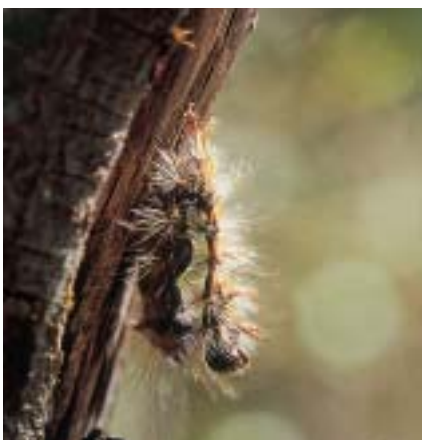
Les mouches Tachinaires contribuent à réduire les populations du Bombyx disparate . Leur asticot se développe à l'intérieur d'une chenille puis abandonne sa dépouille pour se nymphoser dans le sol.