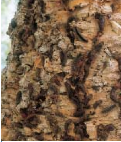
Les chenilles se regroupent généralement dans les anfractuosités des troncs ou sous les grosses branches pour se nymphoser. Cliché C. Villemant

diens Anastatus disparis et surtout Ooencyrtus kuvanae . Ils sont aussi attaqués par des prédateurs (des Coléoptères et un Lépidoptère) qui, en creusant des galeries dans les ooplaques, les disloquent et provoquent la mort d'un nombre d'œufs bien supérieur à celui qu'ils consomment. Ces insectes, au régime carnivore ou détritivore, sont beaucoup plus actifs dans les subé- raies que dans les yeuseraies. Les