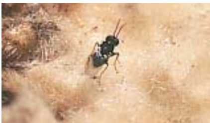
Une femelle du parasite oophage Ooencyrtus kuvanae en train de pondre dans une ooplaque.

diens Anastatus disparis et surtout Ooencyrtus kuvanae . Ils sont aussi attaqués par des prédateurs (des Coléoptères et un Lépidoptère) qui, en creusant des galeries dans les ooplaques, les disloquent et provoquent la mort d'un nombre d'œufs bien supérieur à celui qu'ils consomment. Ces insectes, au régime carnivore ou détritivore, sont beaucoup plus actifs dans les subé- raies que dans les yeuseraies. Les