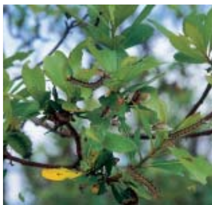
Lorsque tous les chênes sont défoliés, les chenilles affamées se rabattent sur les plantes du voisinage (ici un arbousier).

Les étés chauds et secs, en raccourcissant la durée du développement larvaire favorisent l'explosion des populations. Le froid hivernal n'a, en revanche, aucune influence sur la survie des œufs mais une gelée tardive, en tuant les chenilles nouvellement apparues, peut interrompre brusquement une infestation. Le froid intervient aussi en retardant le débourement des chênes mais les chenilles nouvelles sont capables de supporter un jeûne prolongé. En l'absence de nourriture, elles tissent un fil de