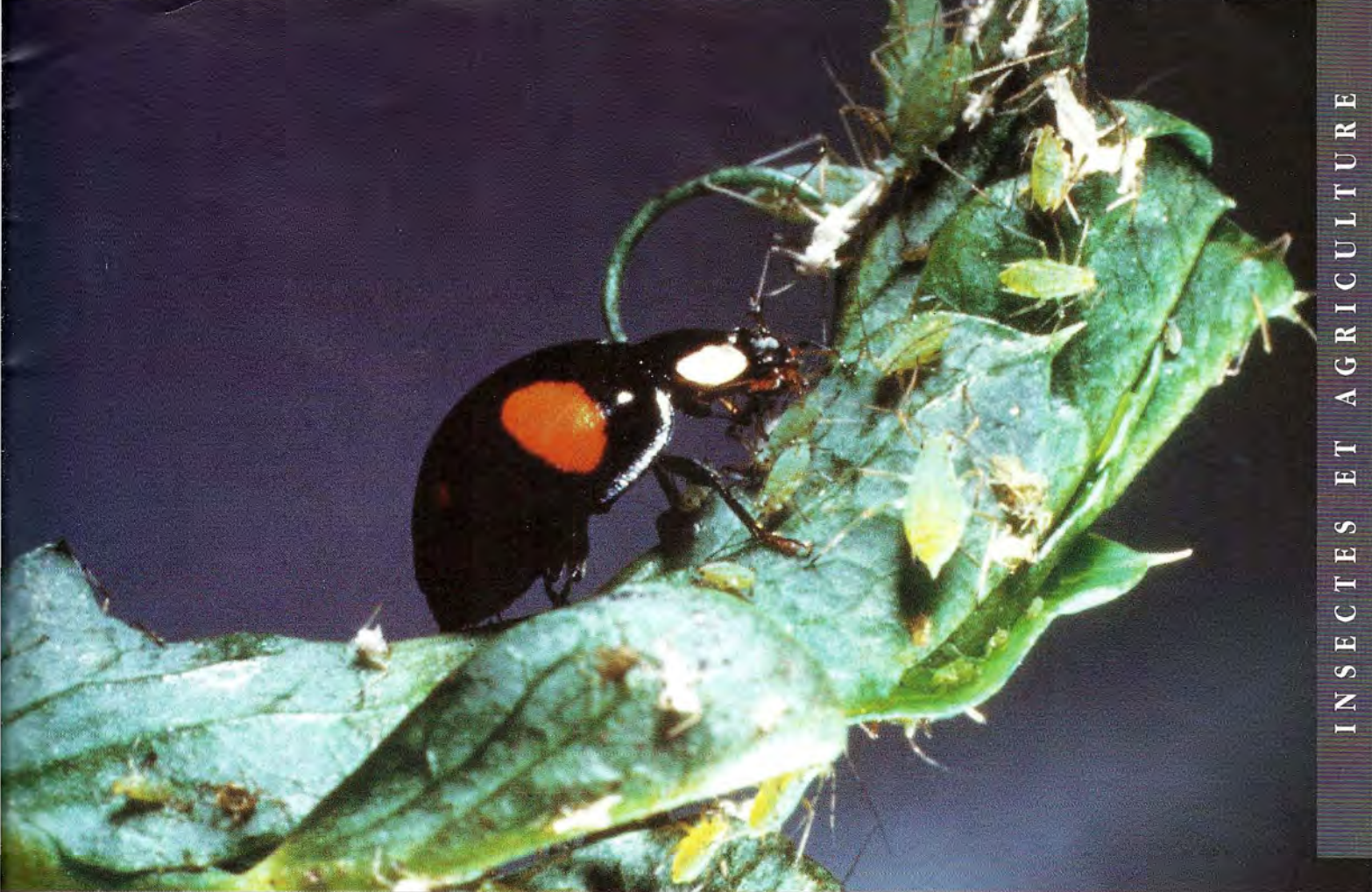
Un adulte d' Harmonia axyridis , tout comme une larve en fin de développement, consomme un grand nombre de pucerons par jour et contribue à une excellente régulation des infestations aphidiennes dans les cultures et les jardins.